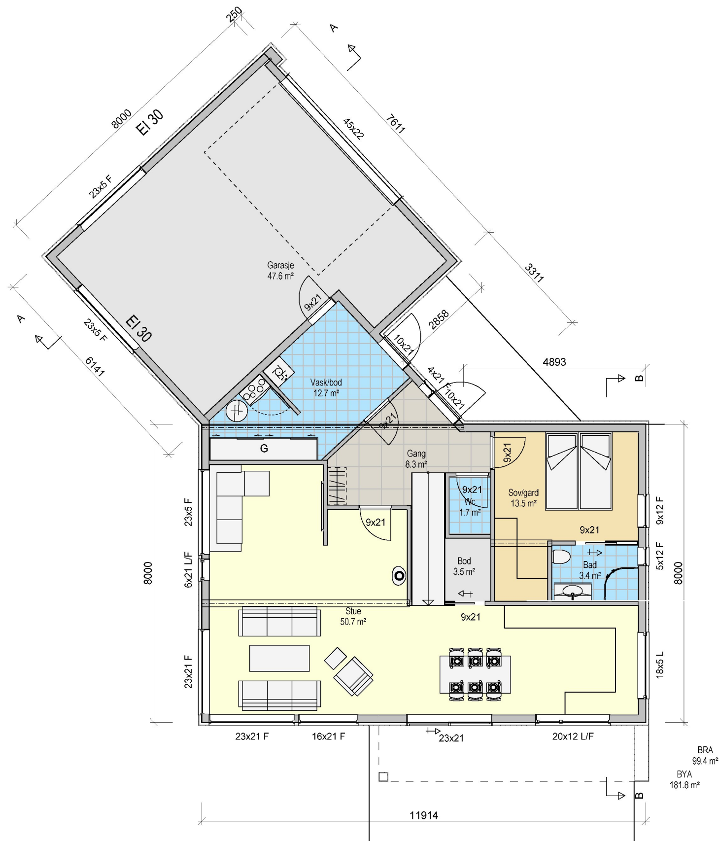
Plan 1 etg