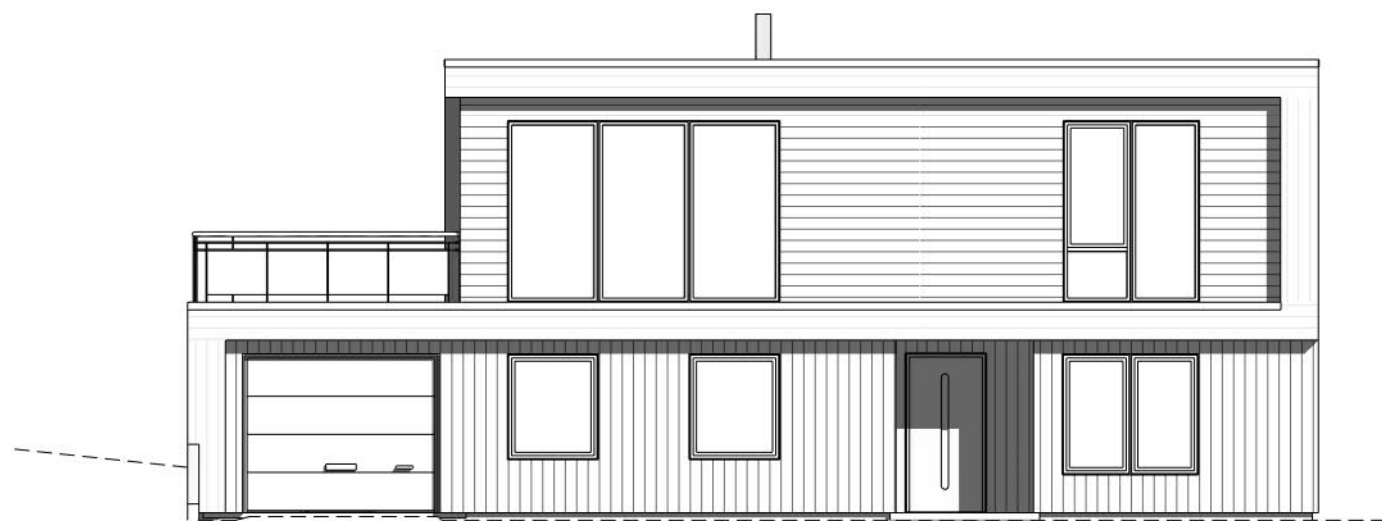
Øst 1 : 100