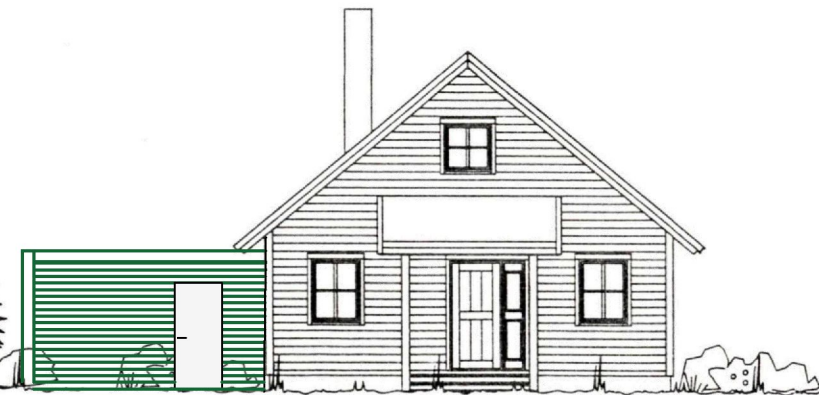
FASADE MOT ØST

Kontrollert 01. Mars 1961 SAKSBEH. PROSJEKT