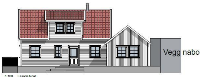
1:100 Fasade Nord