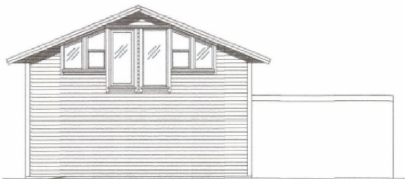
Fasade mot Nord