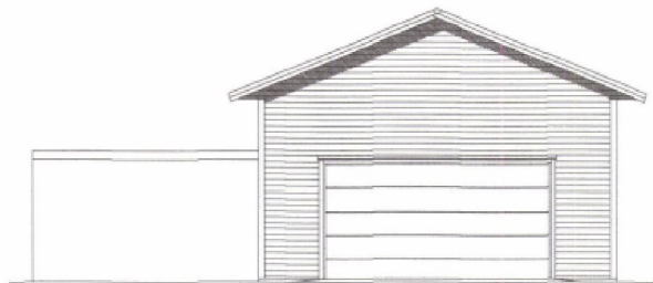
Fasade mot Sør