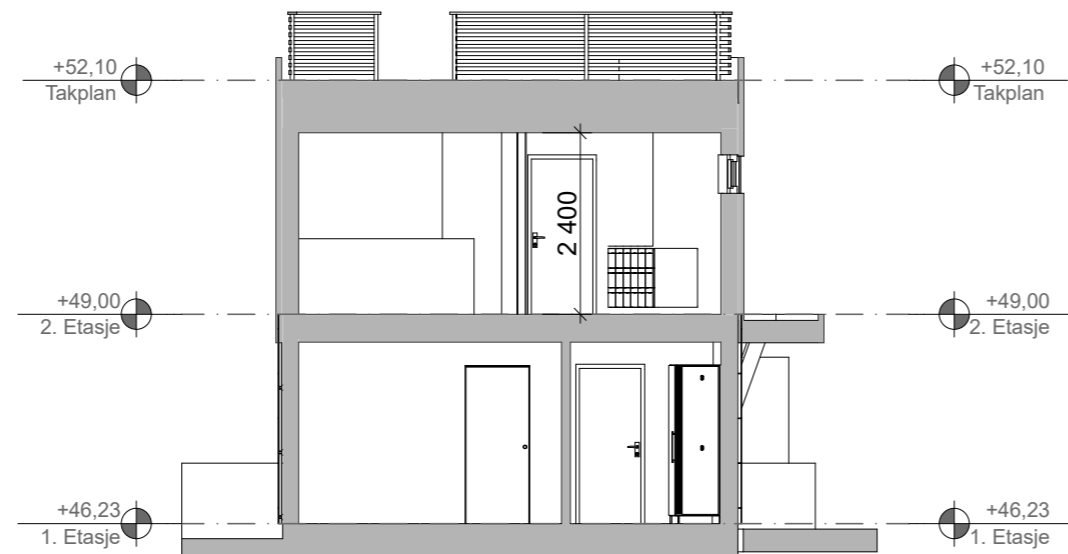
1:100 Snitt A