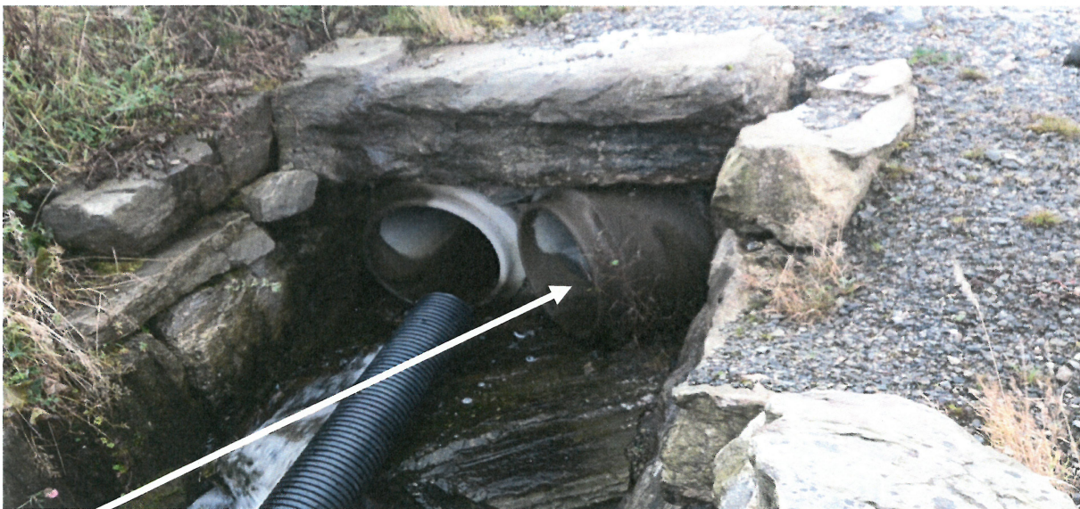
Bilde 10: Utløpsrør fra eksisterende grøft til nåværende steinsatt kanal på andre siden av Gamle Kyrkjevegen.