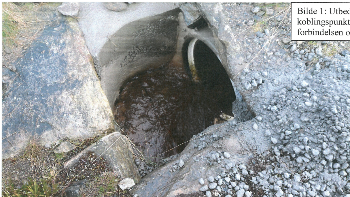
Bilde 1: Utbedring av koblingspunkt mellom T-forbindelsen og ny grøft.