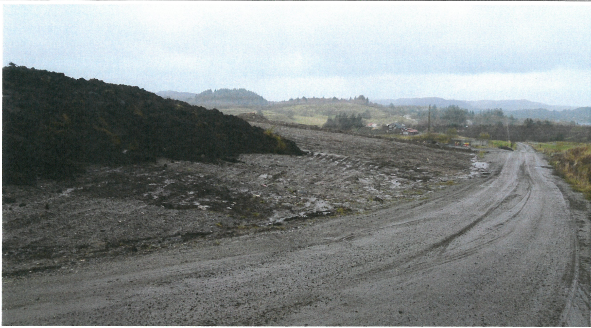
Bilde 11: Påfylling av matjord på godkjent felt 1 (27 da) fra år 2010.