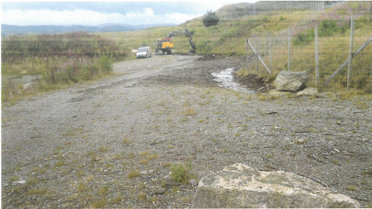
Bilde 3: Påbegynt øvre del av ny grøft fra landbruksundergangen under T-forbindelsen.