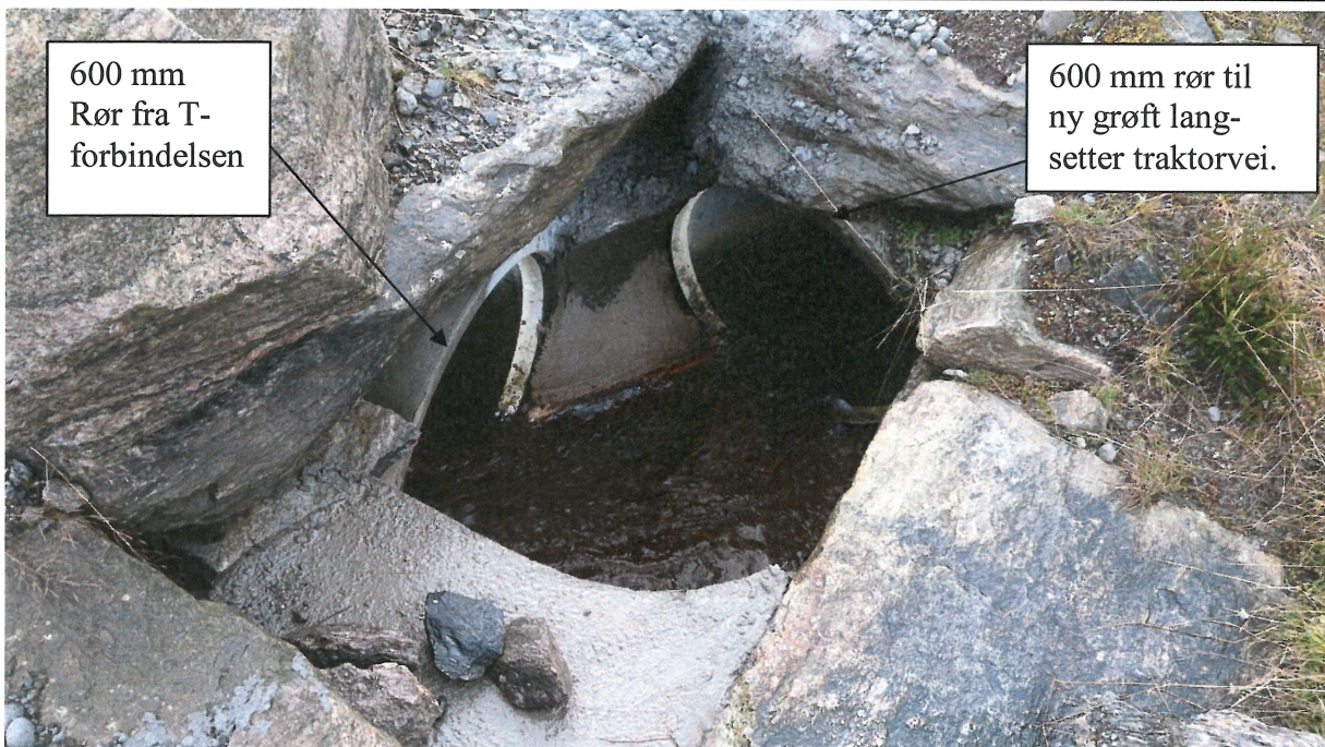
600 mm Rør fra T-forbindelsen