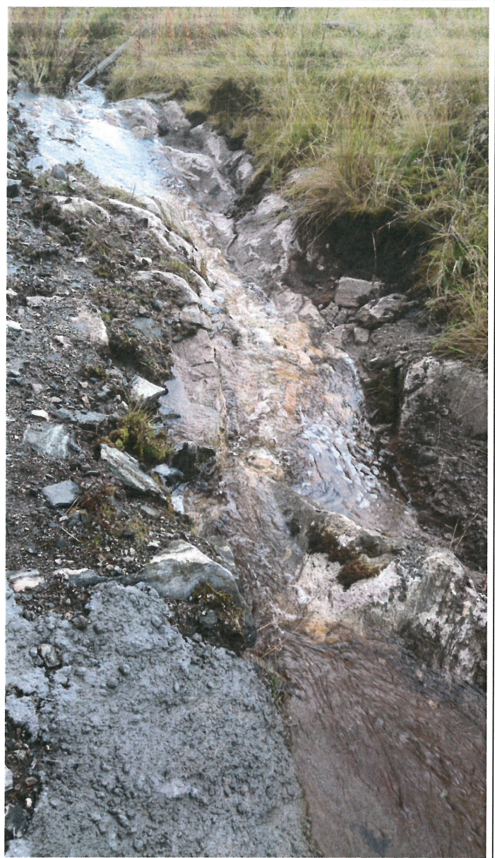
Bilde 7: Detalj, overgang ny grøft til nåværende