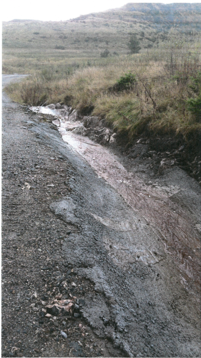
Bilde 6: Oversikt, overgang ny grøft til nåværende