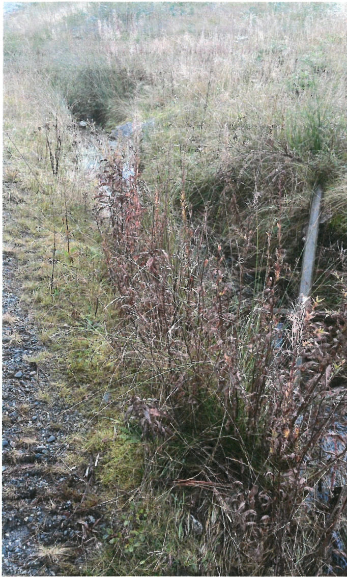
Bilde 8: Eksisterende grøft