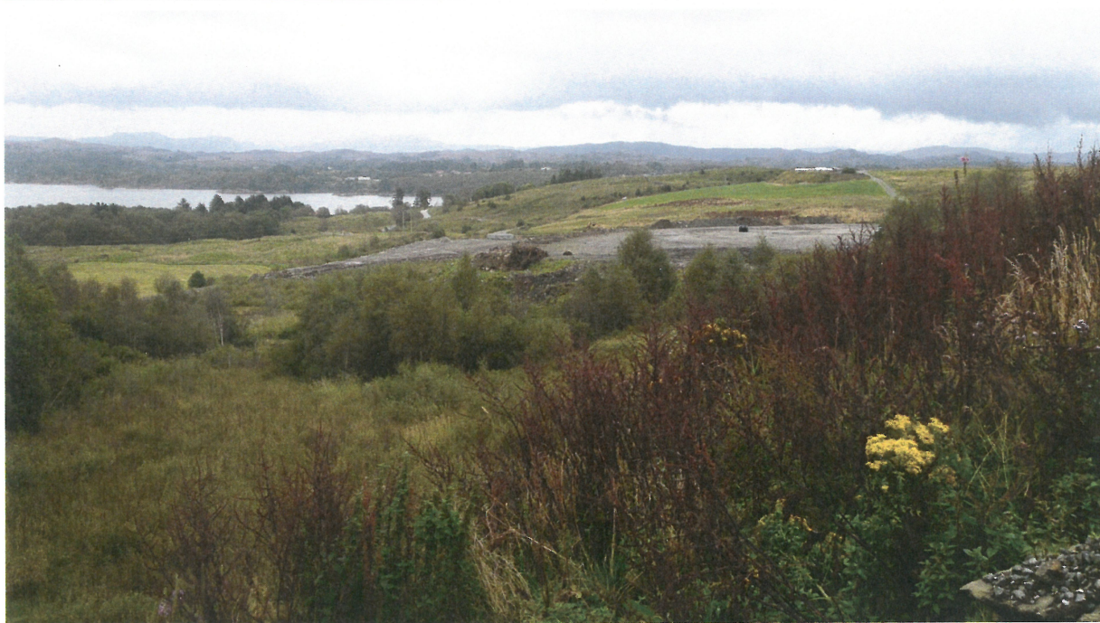
Bilde 4: Oversikt – omsøkte dyrkingsfelt (nord for traktorvegen).