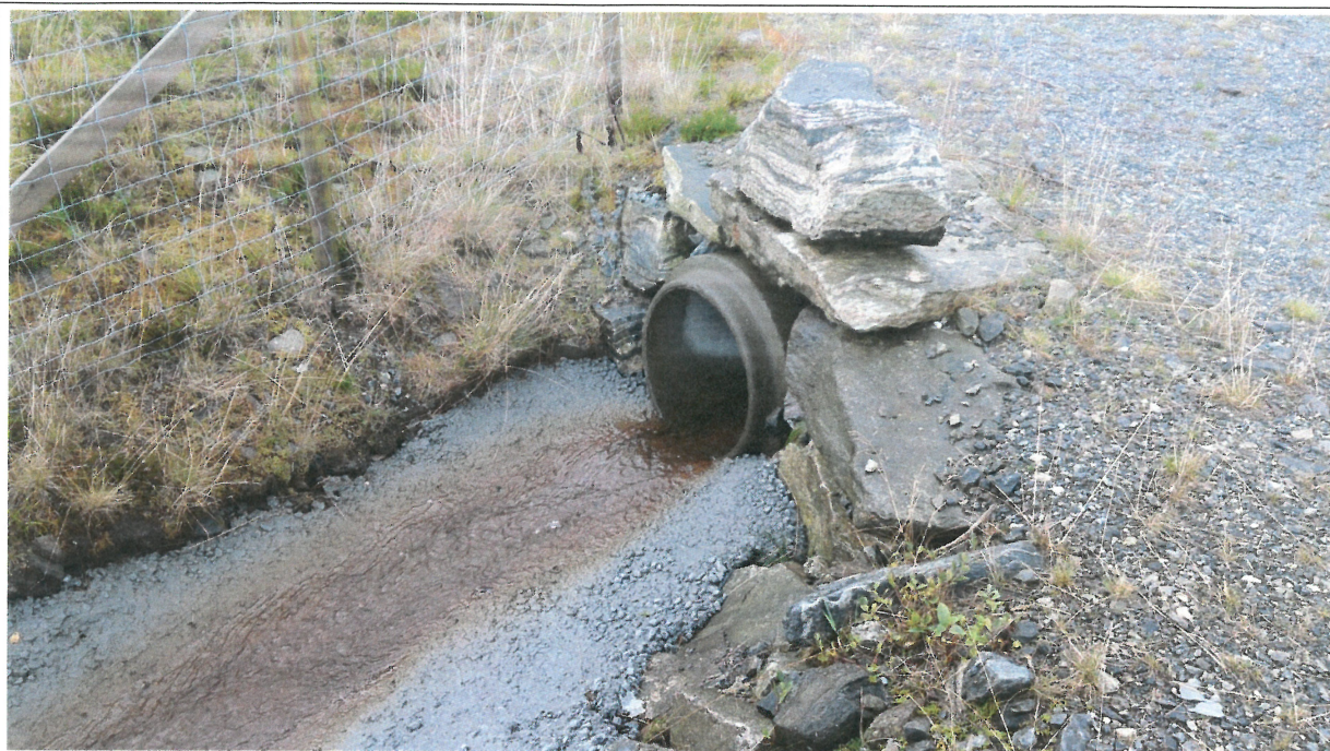
Bilde 3: Start ny åpen grøft.