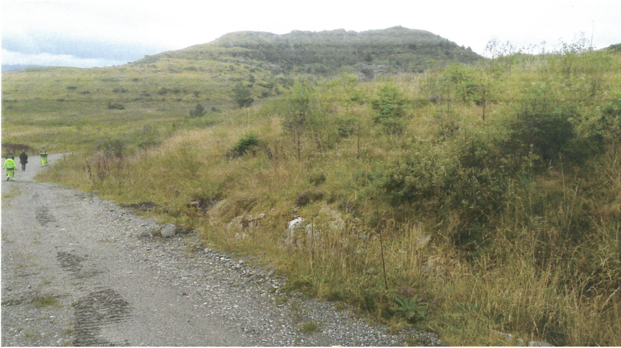
Bilde 5: Oversikt – omsøkte dyrkingsfelt (sør for traktorvegen).