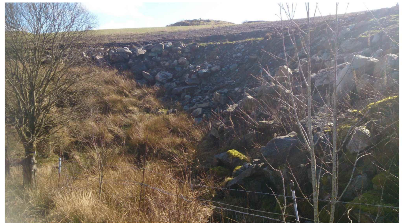
Foto 6: Oversikt: Ikke ferdig avslutning av tidligere godkjent felt II mot naboeiendom 118/4 (se vedl. 6: vilkår 3 og 6 – samt godkjent kart: side 7/24).