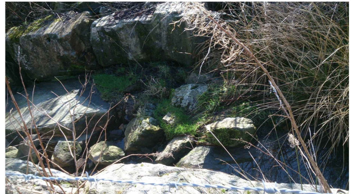
Foto 5: Nåværende ende av ikke fullført steinsatt kanal langsetter grensen mot naboeiendom (118/4).