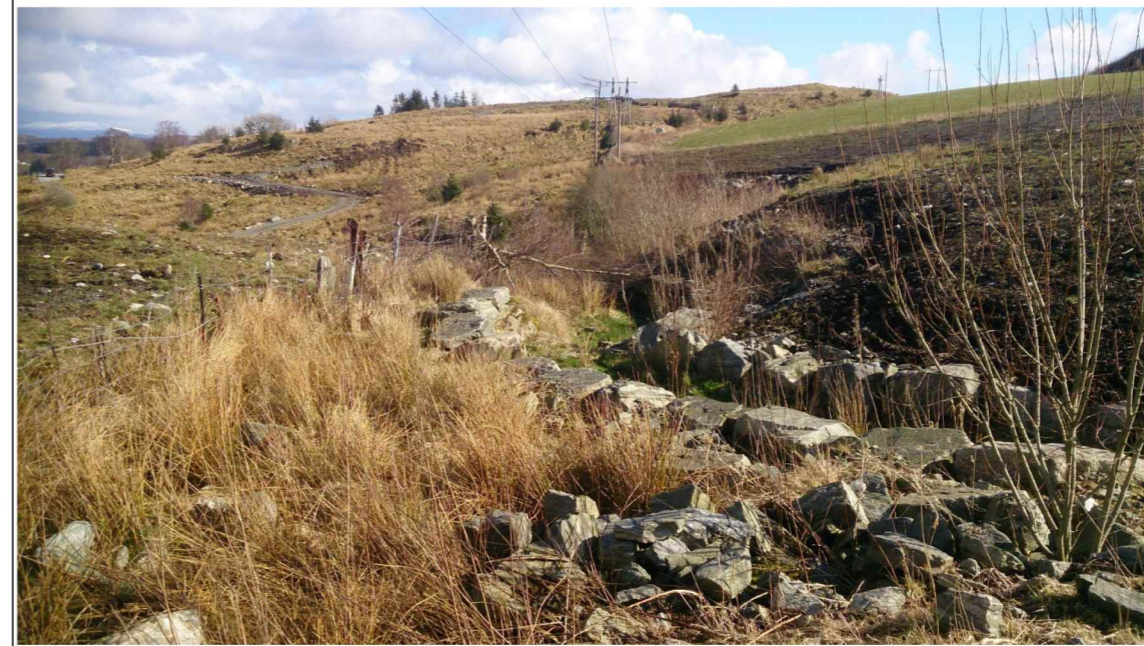
Foto 1: Kanalutløp – langsetter nabogrensen mot gnr/bnr 118/4 (Gunnulv Våge).