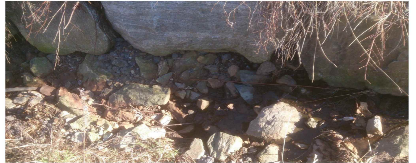
Foto 4: Store deler av normal vannføring renner gjennom steinsettingen – og ut til steinfyllingen under jordbruksarealet som grenser til kanalen.