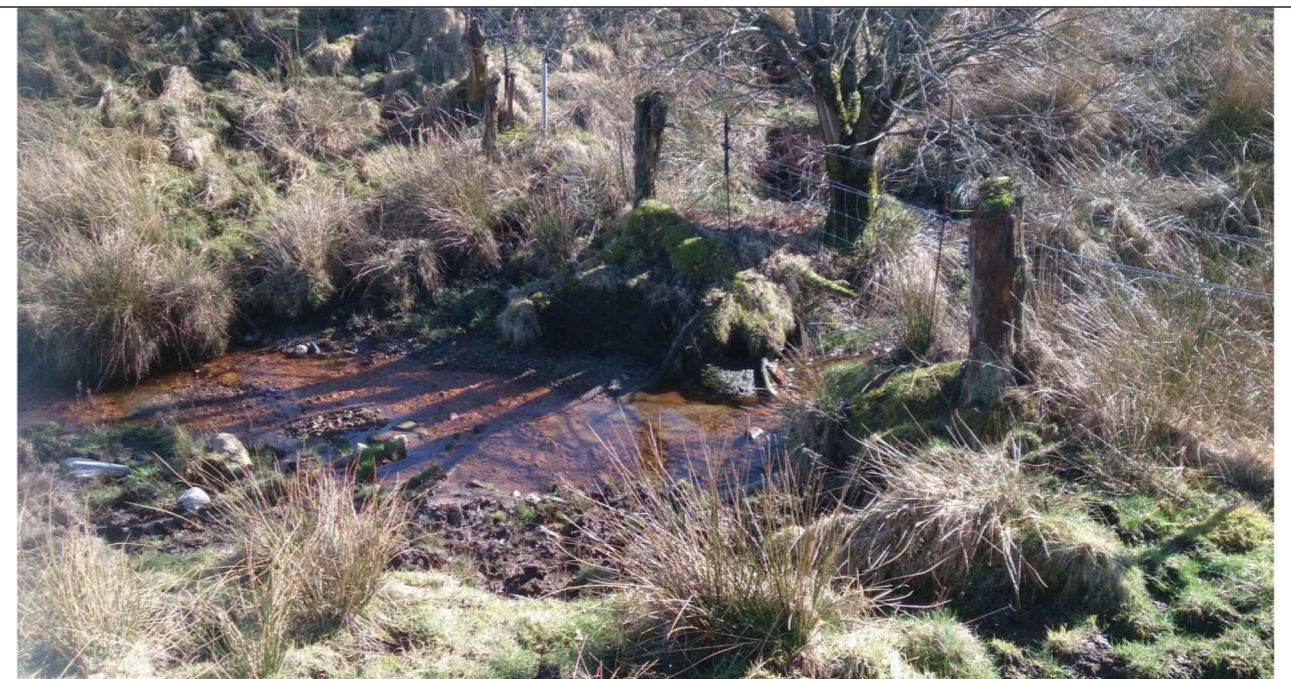
Foto 7: Detalj: Steinsatt kanal er godkjent med fremføring til dette sted ved nabogrensen mot gnr/bnr 118/4 (se henvisning til vilkår under foto 6).