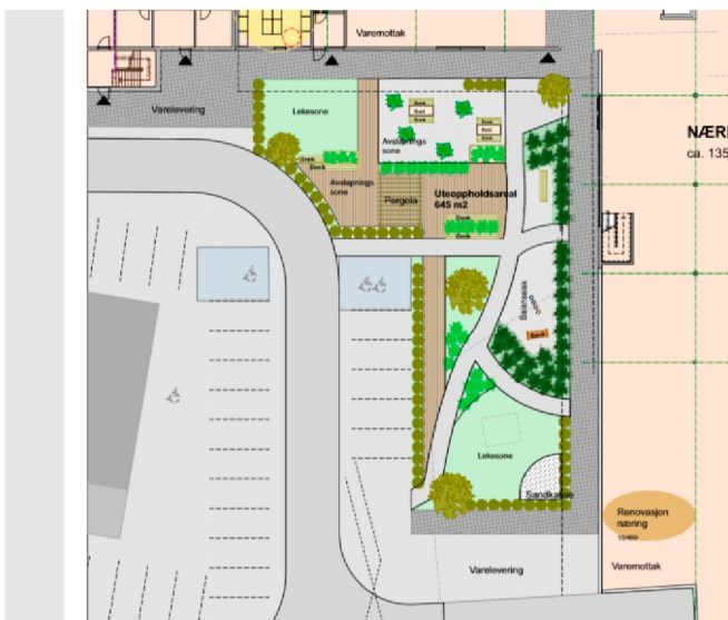
Figur 1: Utenomhusplan i anmodning om å trekke innsigelsen

Det er gjort få endringer i utomhusplanen for uteoppholdsarealet. En av utfordringene ved uteoppholdsarealet, er at det grenser til parkeringsplasser og flere punkt for varelevering/varemottak for næring. Vi er derfor bekymret for at leke- og uteoppholdsarealet ikke er tilstrekkelig sikret mot trafikkfare. I planforslaget som nå er på høring, er det lagt til ytterligere parkering som grenser til uteoppholdsarealet. Det er heller ikke sikret avbøtende tiltak i bestemmelsene for å ivareta sikkerheten. Slik som fysisk stengsel mellom lekeareal og varelevering/parkering og bruk av variasjon i gatedekket for å fremheve at dette er et sambruksareal for både gående og kjørende. Statsforvalteren kan derfor ikke se at vår innsigelse er imøtekommet og opprettholder innsigelsen. Vi kan ikke se at kvaliteten på uteoppholdsarealet er forbedret.