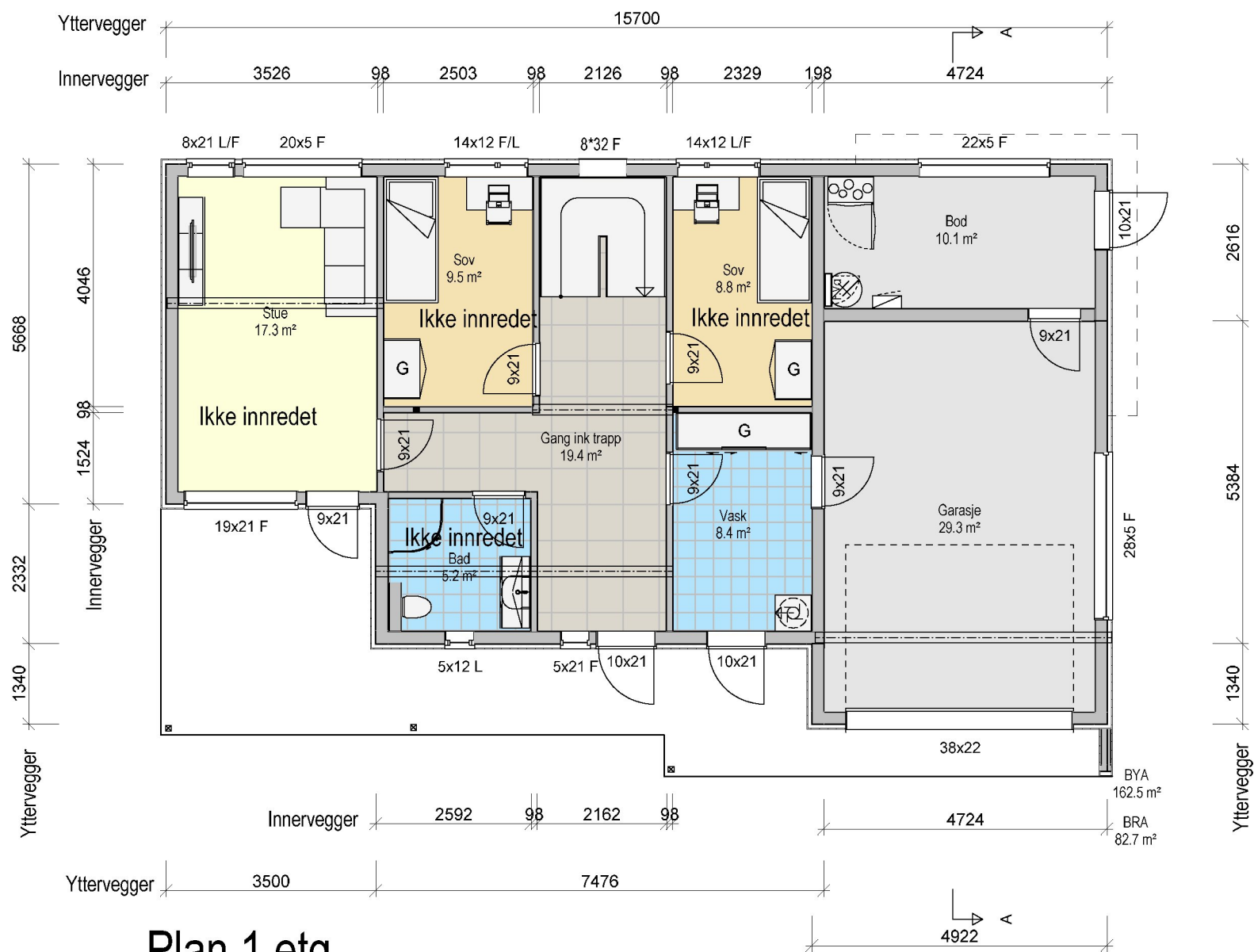
Plan 1 etg