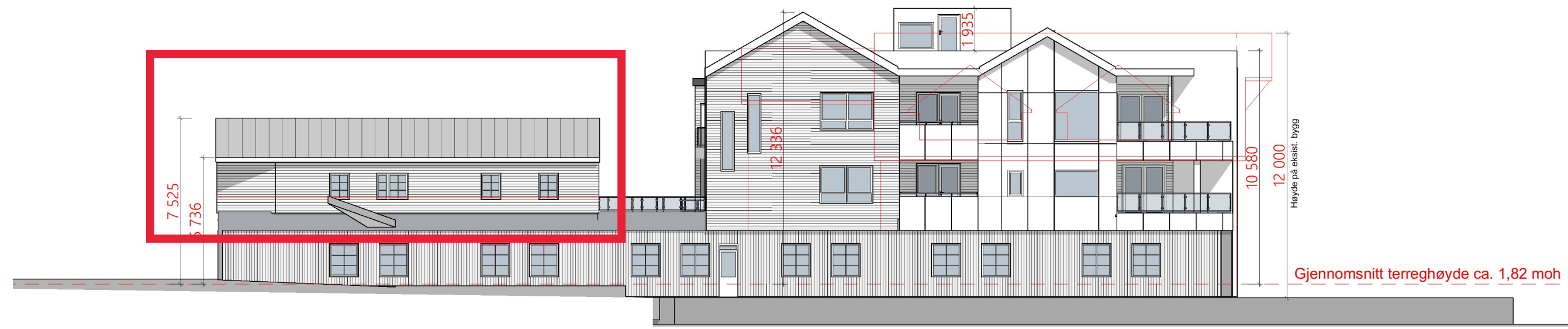
1:200 Fasade Vest