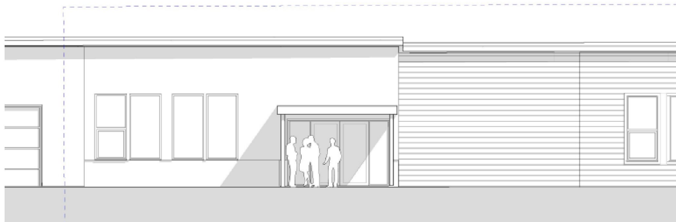
Fasade Nord Etter endringa