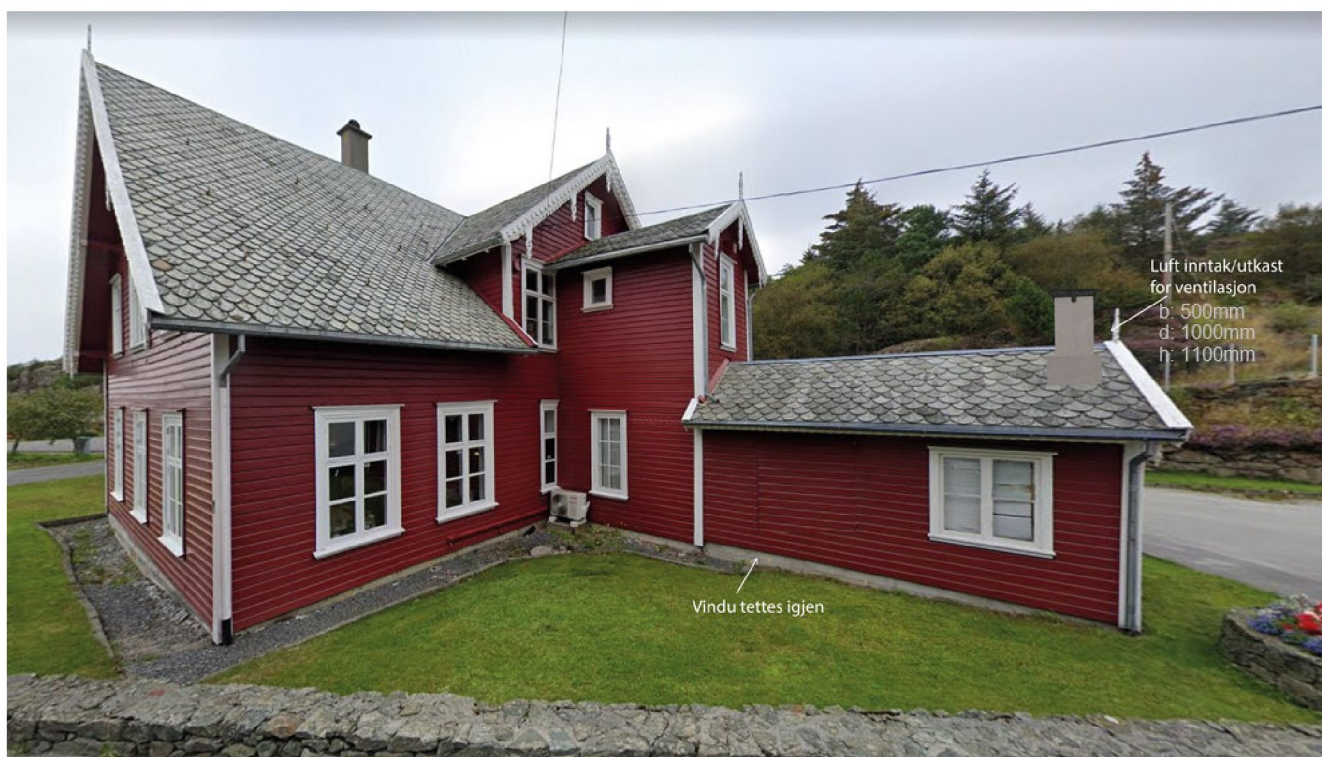
Fotoillustrasjon vestsida av hovedbygg