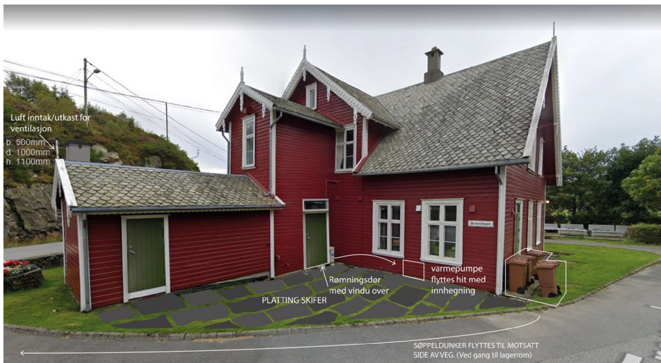
Fotoillustrasjon østside av hovedbygg