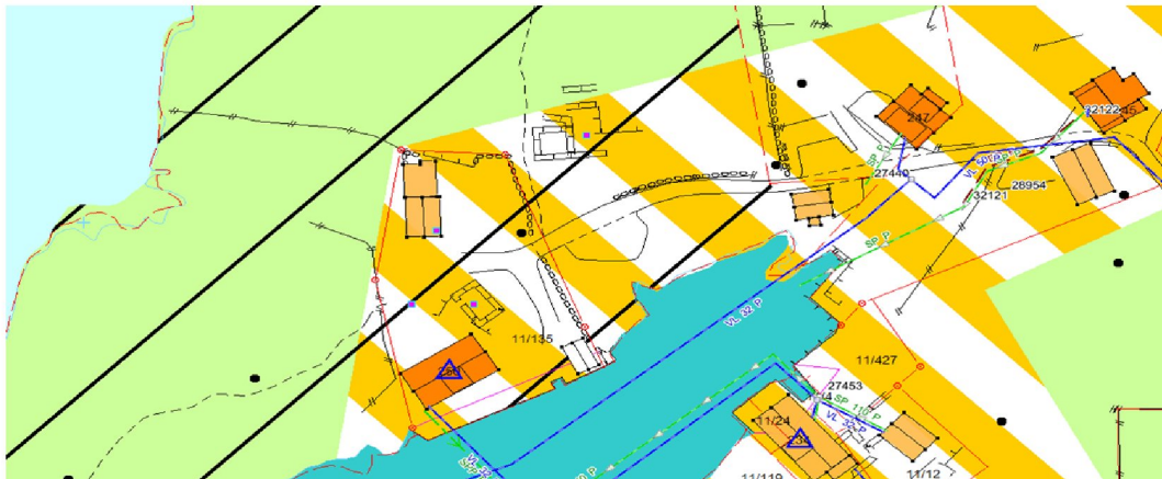
Kommuneplanen- skråkravur er hensynssone kulturminner