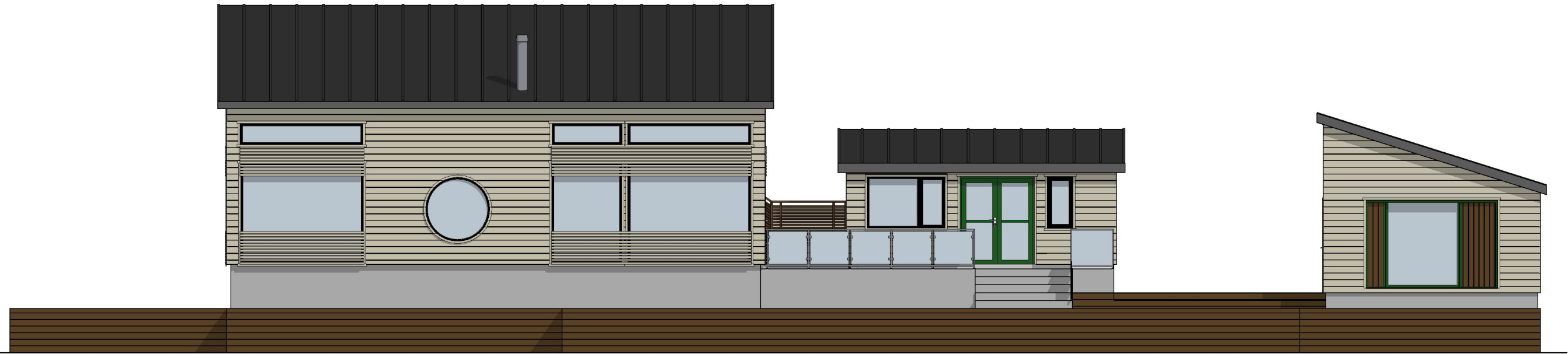
1:100 Fasade Vest