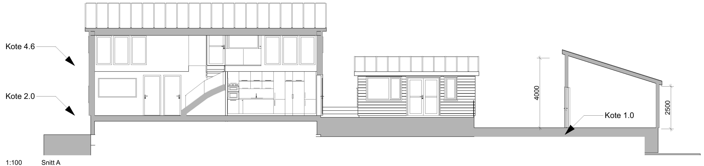
1:100 Snitt A