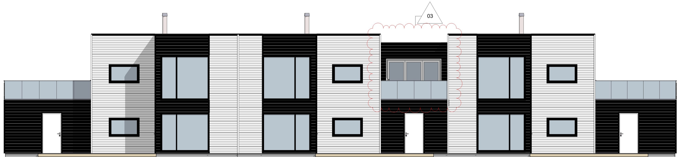
1:100 Fasade Vest