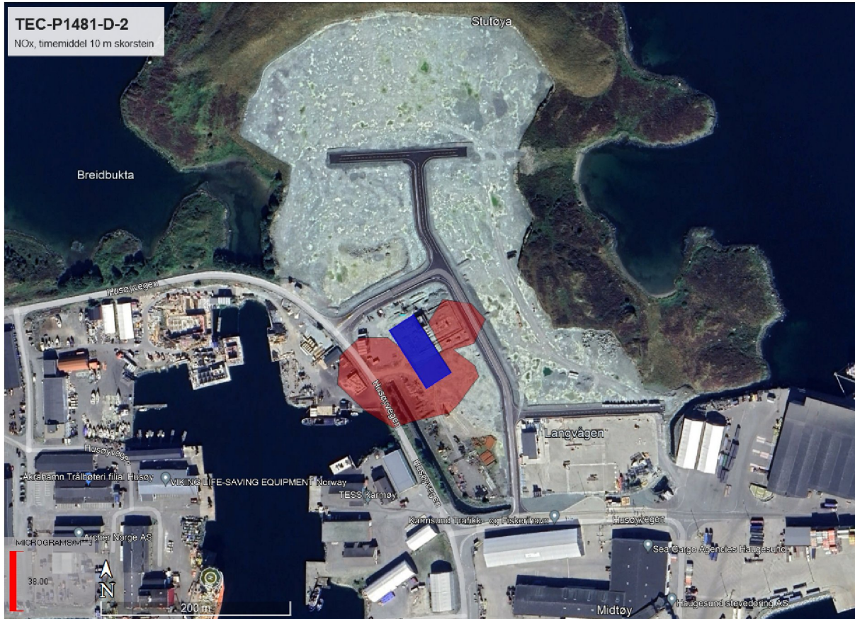
Figur 3. Resultat spredningsberegning

Figur 3 viser resultatene fra spredningsberegningen.