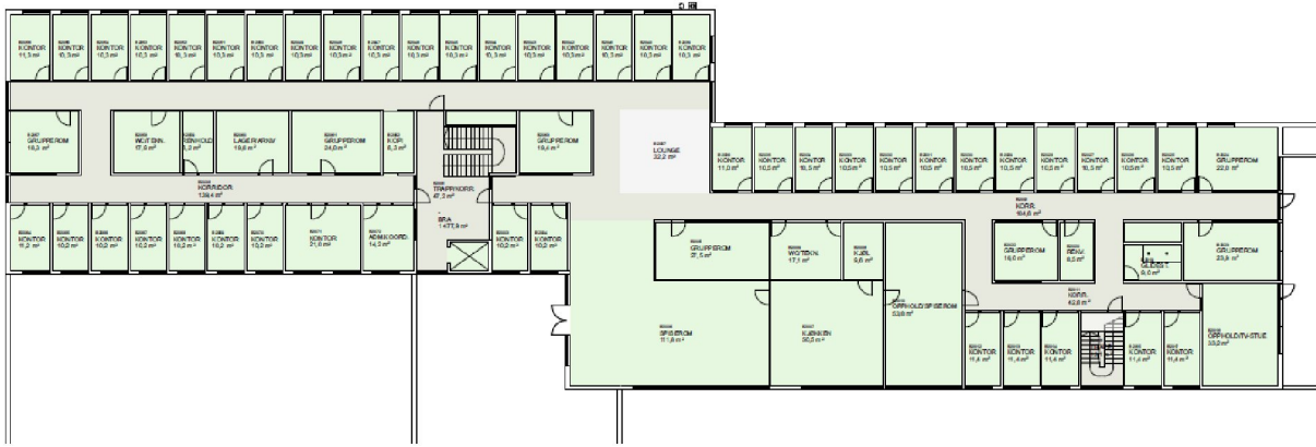
Figur 2: Plantegning 2. etasje hovedbrannstasjon

Det er gjort en grundig gjennomgang for å avdekke de risikoene prosjektet er eksponert for. Disse kan kort deles inn i organisatoriske og tekniske risikoer. Identifiserte tekniske risikoer er tatt høyde for i kostnadsestimat hvor det er mulig, mens organisatoriske risikoer må behandles fortløpende av prosjektadministrasjonen. Den største risikoen som er identifisert er usikkerhet rundt prisstigning som har vært det siste året, og som aktualiseres på nytt med krigen i Ukraina. Siste år har prisstigningen på Statistisk sentralbyrås indeks boligblokk i alt vært på 5,8%. Det er satt av en sum for prisstigning i kostnadsestimatet, men det hersker stor usikkerhet om hvordan fremtiden blir. Slik situasjonen er nå, er det heller ikke forsvarlig å binde entreprenører til en kontrakt uten prisstigning, da det ikke vil være mulig å forutsi.