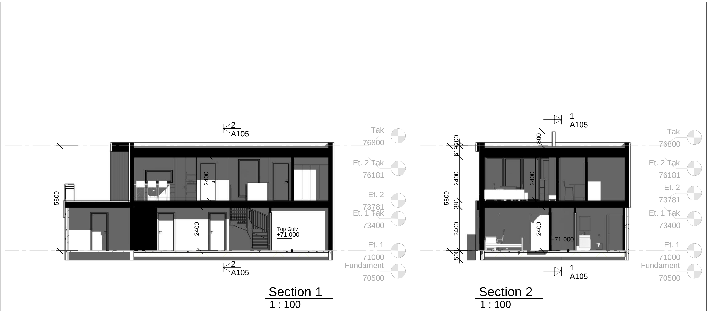
Section 1 1 : 100