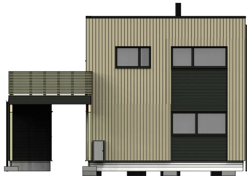
Fasade mot øst