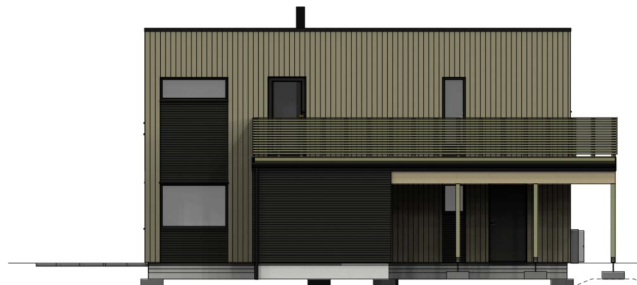
Fasade mot sør