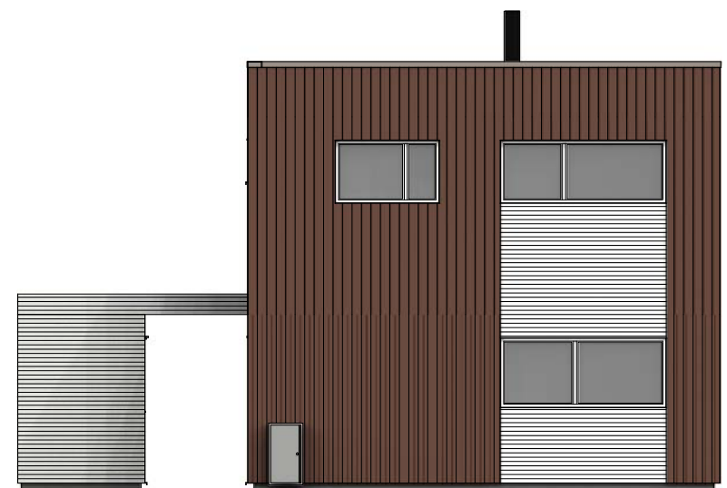
Fasade mot nord - øst