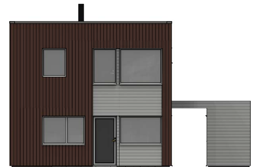
Fasade mot sør - vest