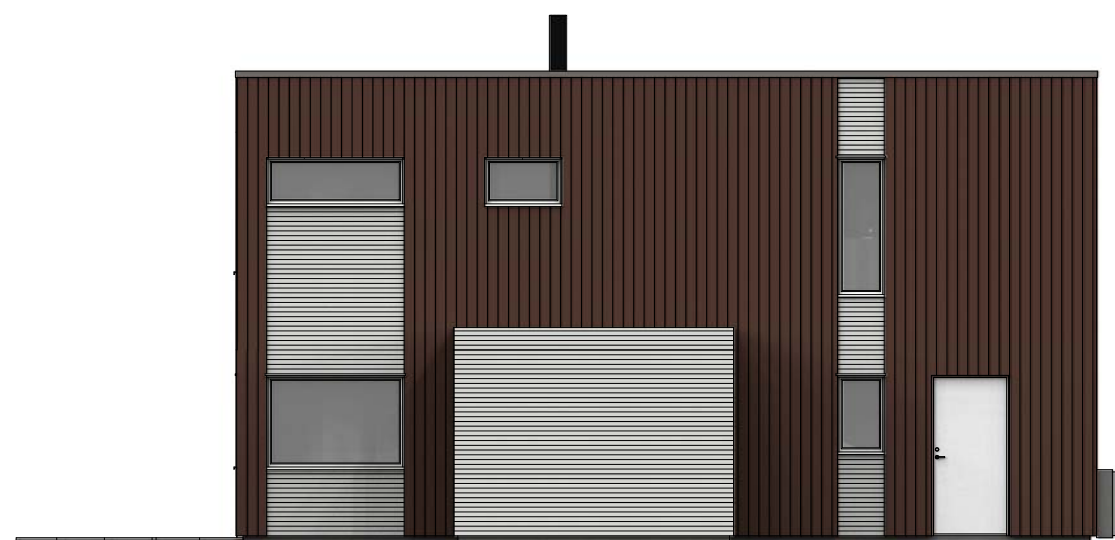
Fasade mot sør - øst