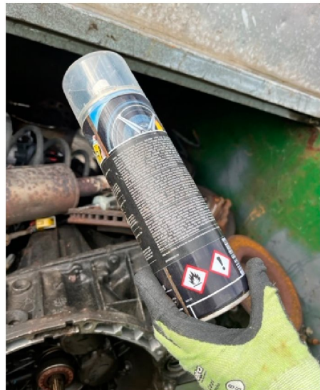
Bilde 1: Sprayboks funnet i metallavfallet.

Virksomheten kan ikke dokumentere at farlig avfall levert til et lovlig avfallsmottak.