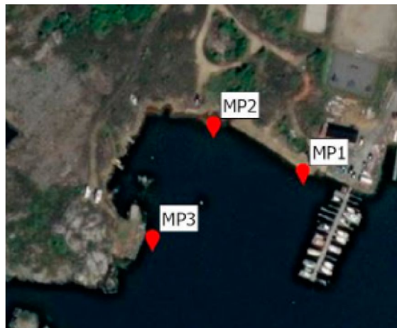
Figur 2: Prøvepunkter (MP#) i Visnesbukta som er analysert for miljøgifter.

Etter vår vurdering vil gjennomføring av tiltaket på denne måten ikke medføre varig forringelse av vannforekomsten i sin helhet (jf. vannforskriften § 4). Tiltakshaver må dekke kostnader ved å begrense eventuell skade på naturmiljøet som følge av tiltaket, jf. naturmangfoldloven § 11.