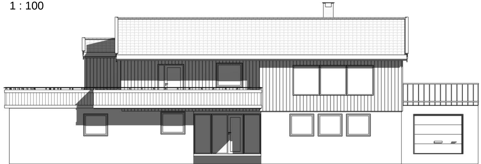
Sør 1 : 100