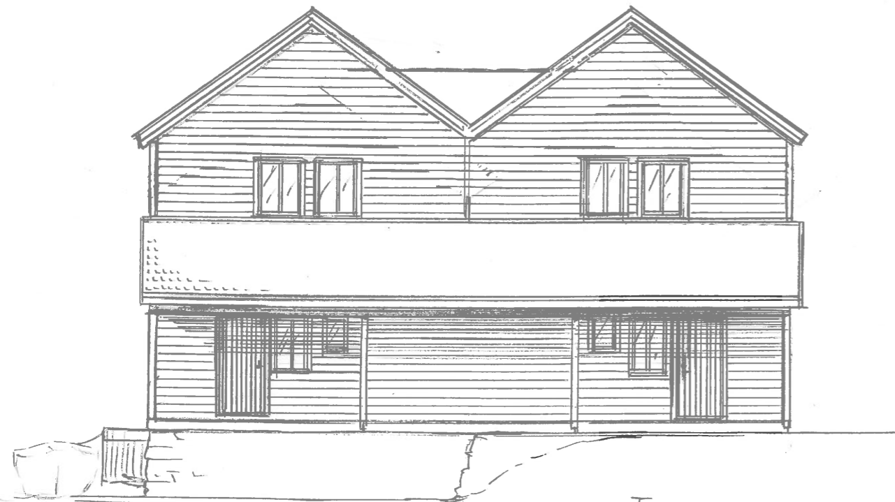
FASADE SÖR ÖST