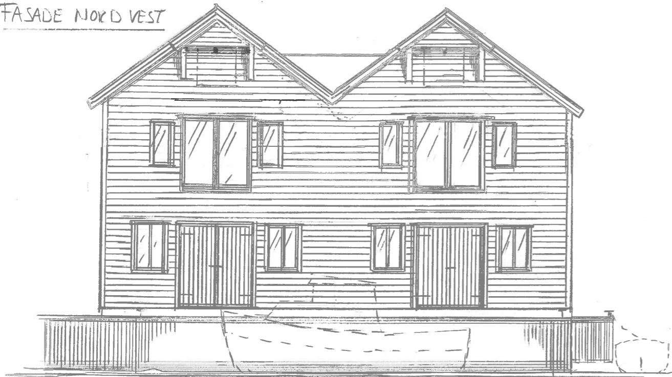
FASADE NORD VEST