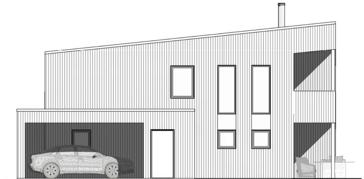
Vest 1 : 100