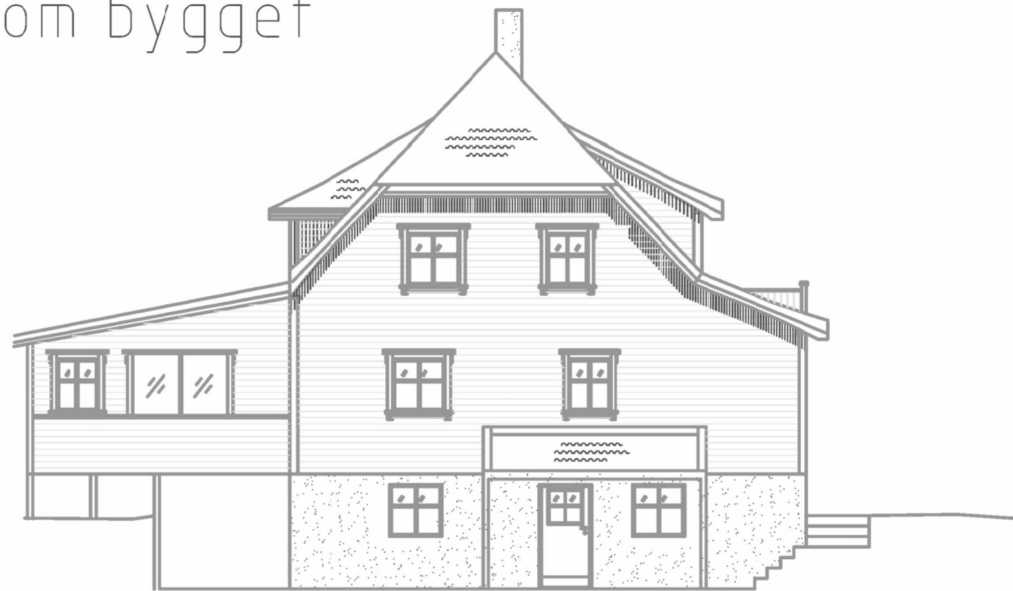
Fasade mot Øst