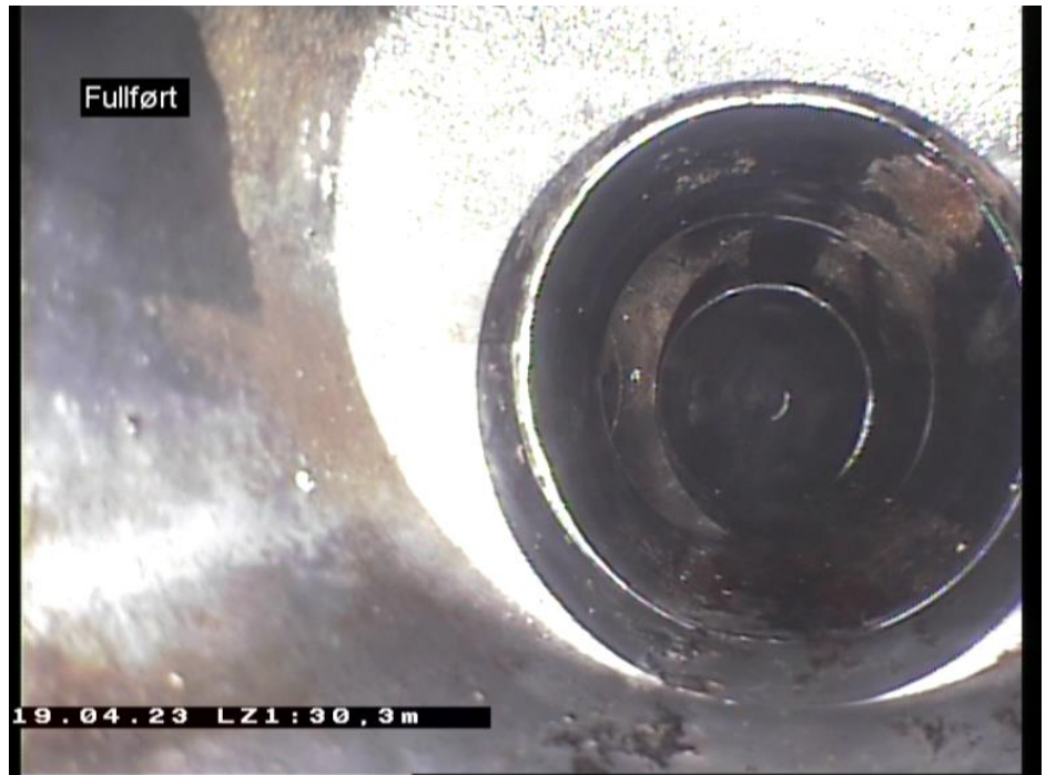
Foto 007 Video 00.04.01 Fjerning 30,30 m Fullført

Dato 19.04.2023 Opptak 14-12 Årvollvegen 44, mot hovedhus, 110mm, plast