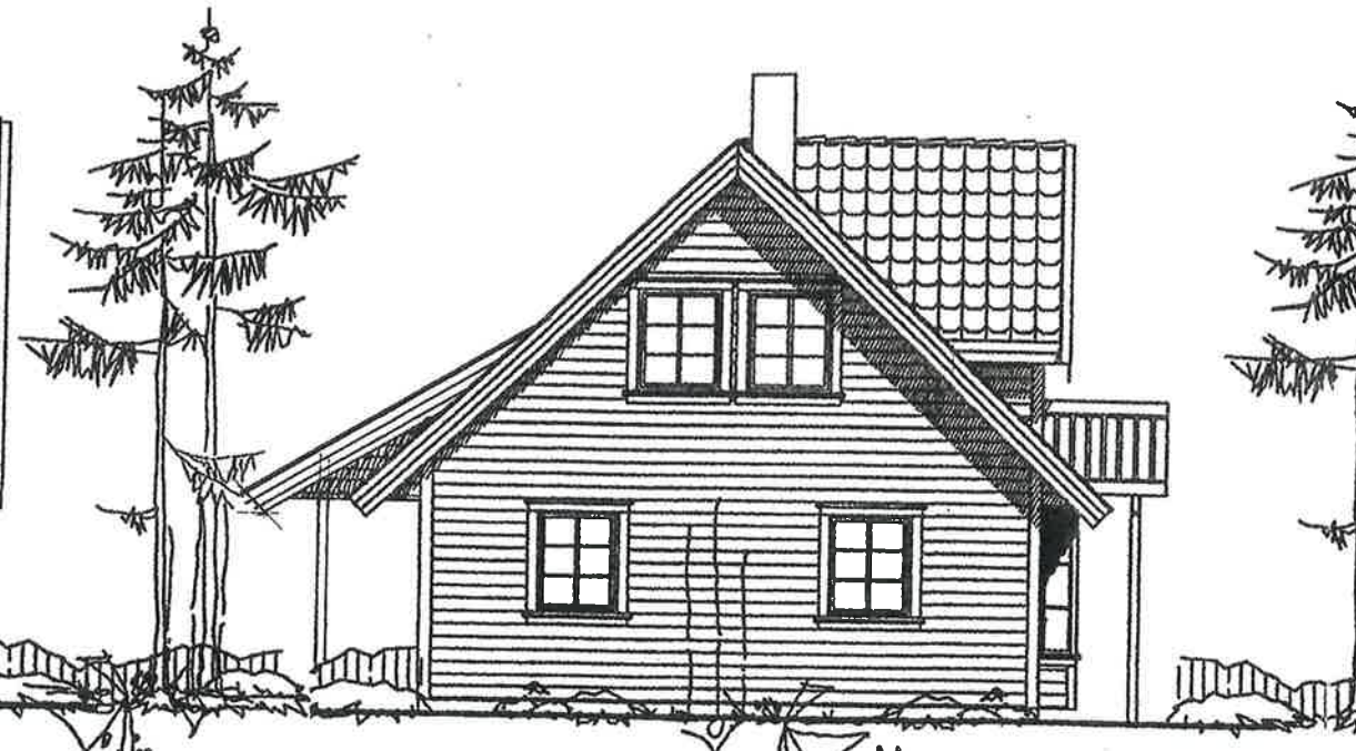
FASADE MOT SØR, EKISTERENDE