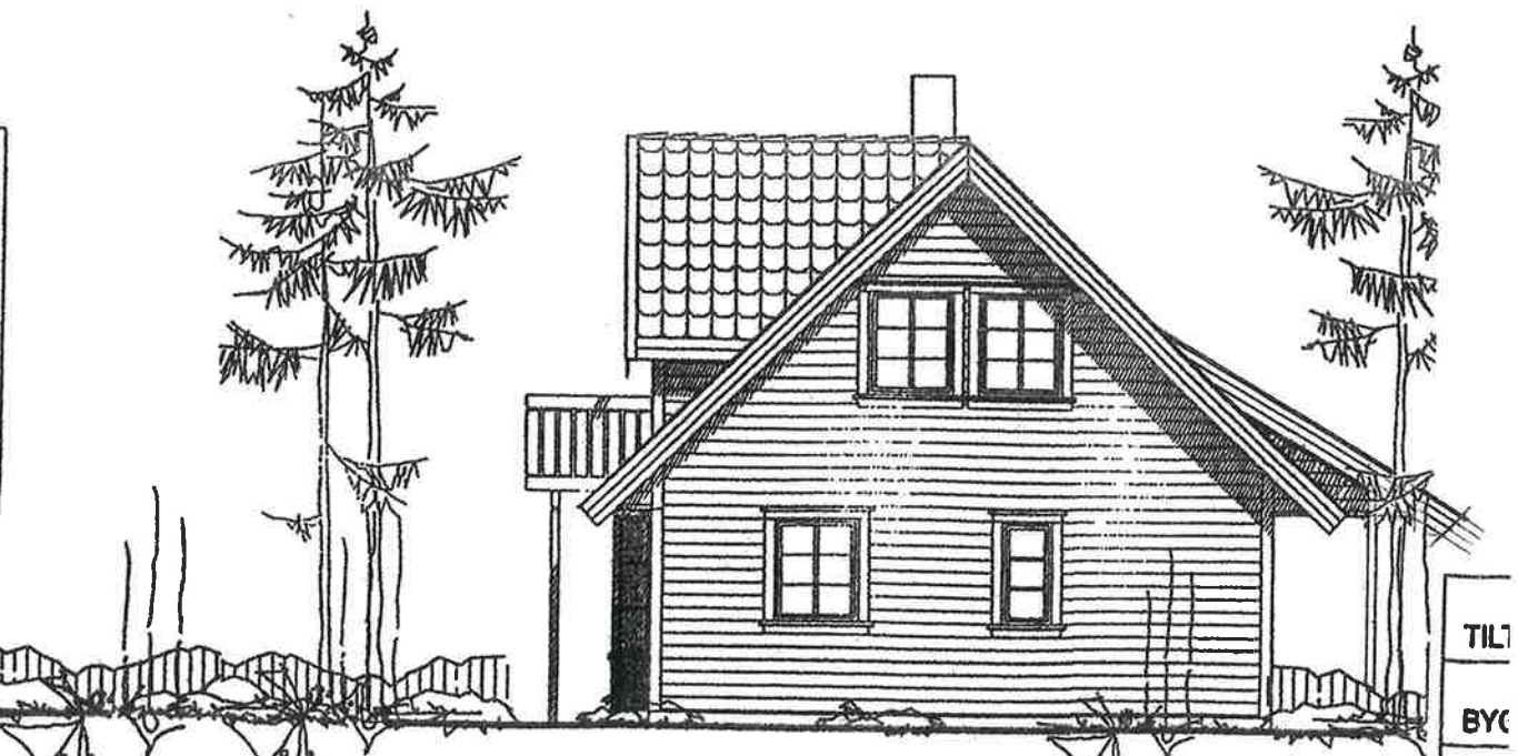
FASADE MOT NORD, EKISTERENDE