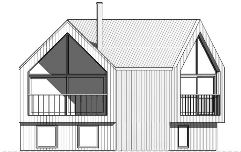
Vest 1 : 100