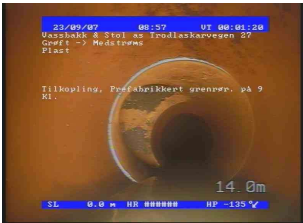
07.09.2023 08_48_21_1625b56c-a9c3-4d50-9638-de68b83aa4a7_20230 907_085042_614.jpg, 00:01:16, 14.00 Tilkøpling, Prefabrikkert grennrør, på 9 Kl. / Påkobling nr 25