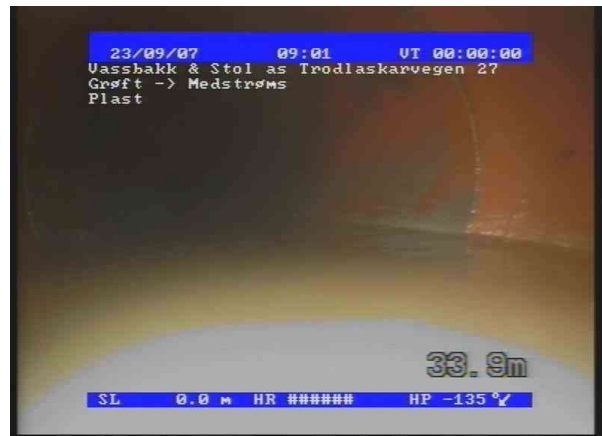
07.09.2023 08_48_21_81db3b85-d7a2-40be-ae37-7c09d346f31b_202309 07_085519_647.jpg, 00:03:54, 33.90 Vannivå, 10%, start