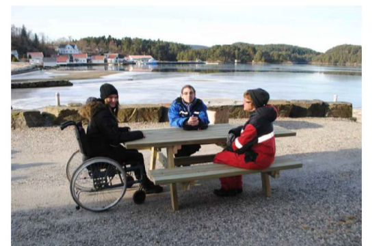
Benkebord med plass til rullestol