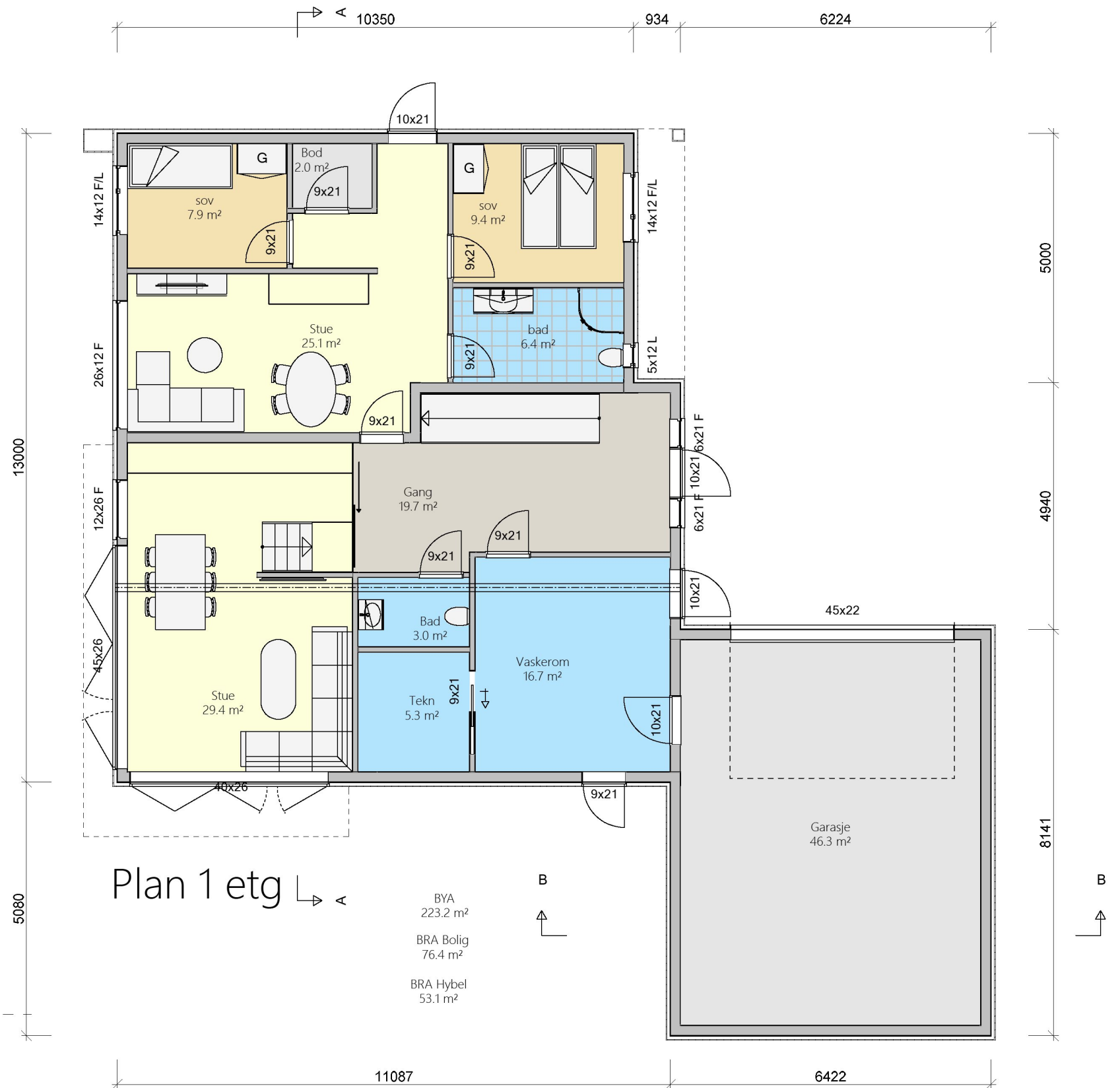
Plan 1 etg

BYA 223.2 m 2 BRA Bolig 76.4 m 2 BRA Hybel 53.1 m 2