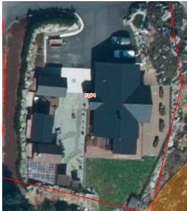
Figur 1. Eiendommen 53/74