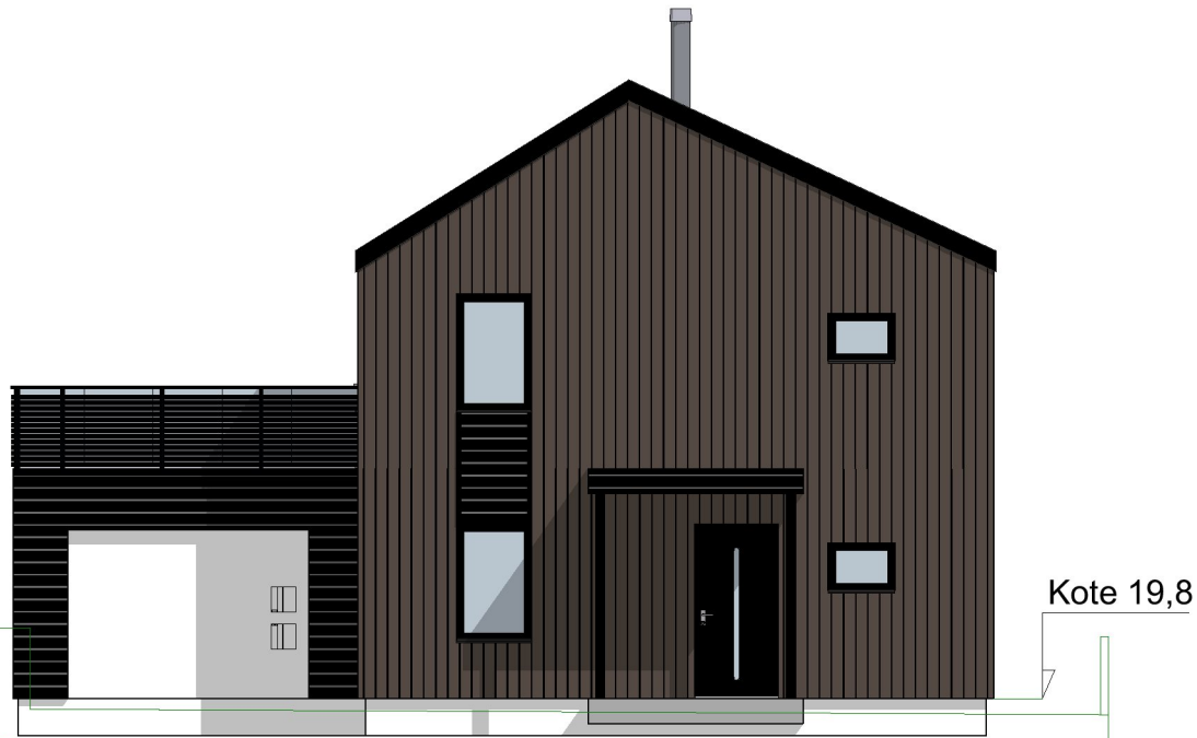
1:100 Fasade Øst