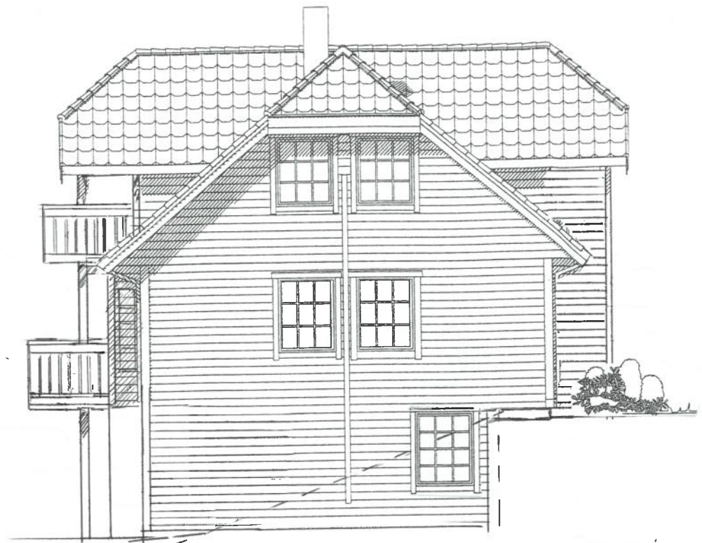
fasade mot VEST