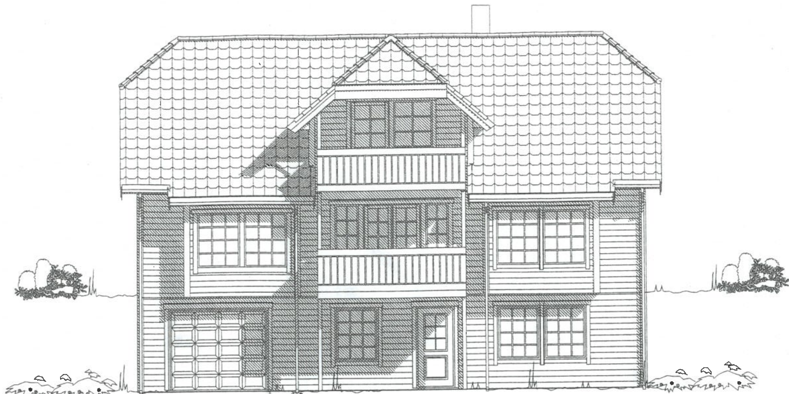
fasade mot NØYD