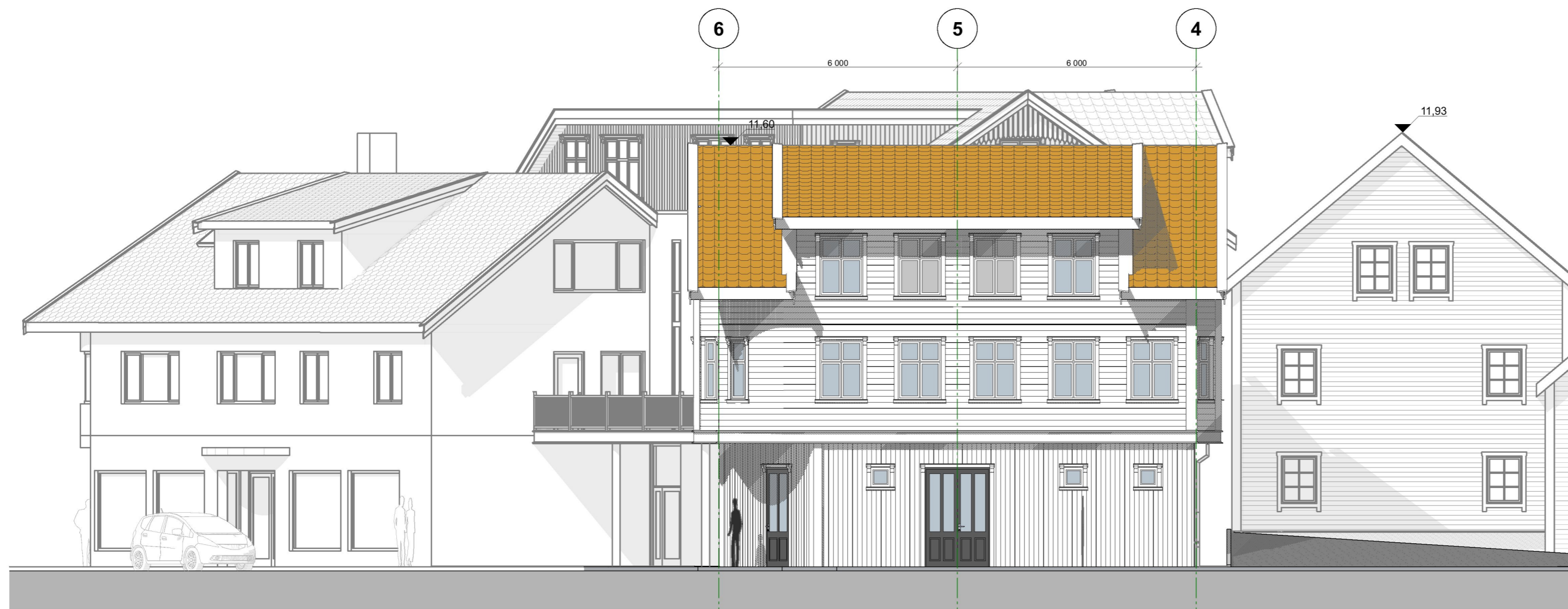
1:100 Fasade Vest (Bygg Vest)