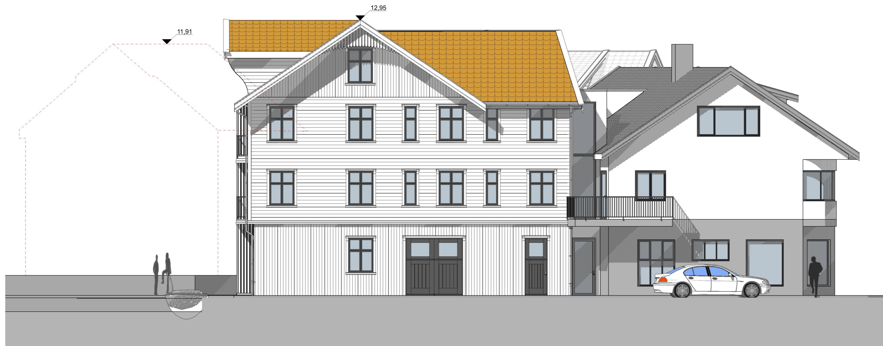
1:100 Fasade Øst (Bygg øst)