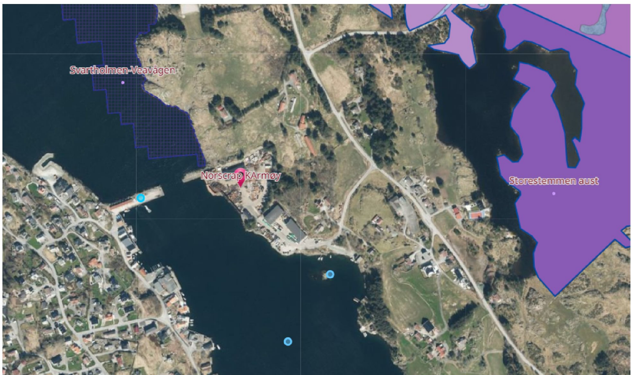
Figur 2: Oversiktsbilde med naturverdier. Informasjon hentet fra temakart-rogaland.no

Norscrap er lokalisert i et område regulert til industri. Det er annen industri, boligfelt, og LNF-områder i nærheten. Øst for anlegget er det områder med sterk trua naturtype kystlynghei. Området Storestemmen aust ligger i luftlinje ca. 500 m øst for anlegget til Norscrap.