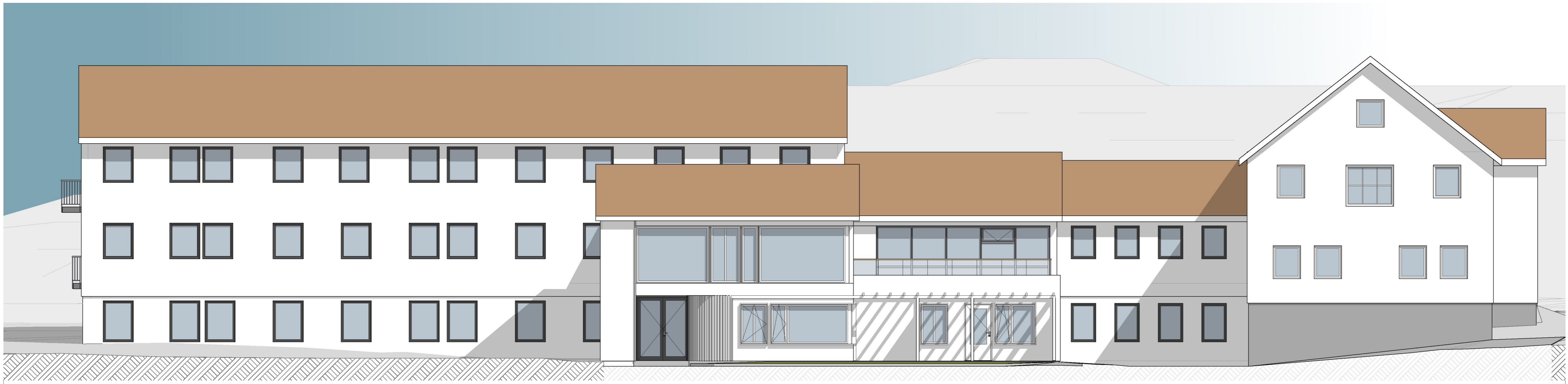
1:100 Fasade SørVest