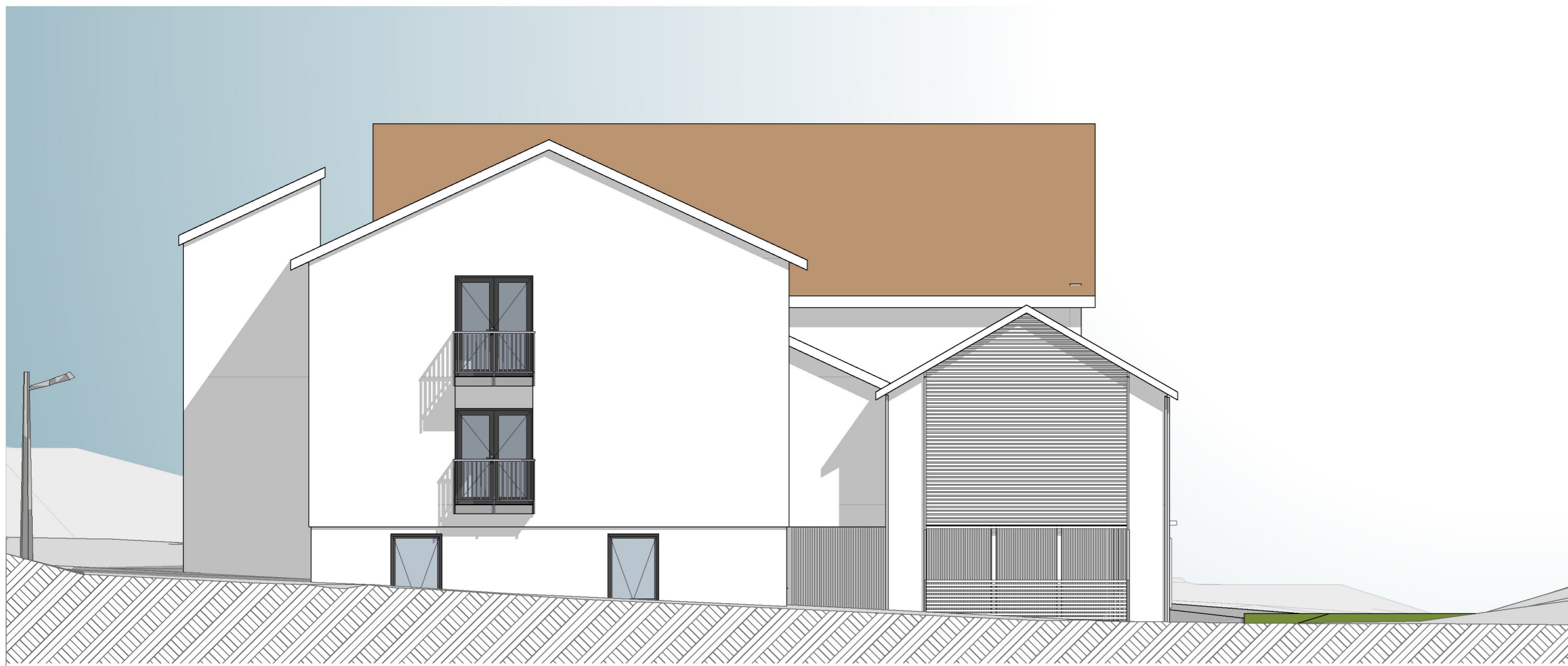
1:100 Fasade NordVest