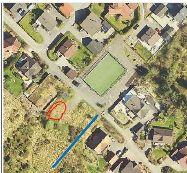
Figur 5: Funnsted fagerfredløs ca. 20 meter fra ledningstraseen sør for ballbinge

Det er foretatt en befaring og registrering av fremmede arter av naturforvalter i kommunen som er oppsummert i e-post av 7.12.2022. Det var ingen tegn til parkslikrekne i området langs eller ved ledningstraseen. Riktig nok var årstiden ugunstig og små planter kan i teorien ha vært lite synlige. Naturforvalteren har vurdert det slik at parkslikrekne ikke er et problem langs traseen.