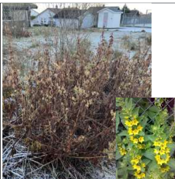
Figur 6: Funnsted fagerfredløs i ledningstraseen sør for ballbinge, foto desember og innfelt «i sommerblomst»

Derimot er det funnet en annen fremmed art: fagerfredløs som har "svært høy risiko" for spredning i norsk natur. Den har ikke samme negative potensiale med krav om omfattende tiltak som parkslikrekne. Ledningstraseen ligger ca. 20 meter lenger øst og maks. bredde på gravearbeid blir 10 meter.