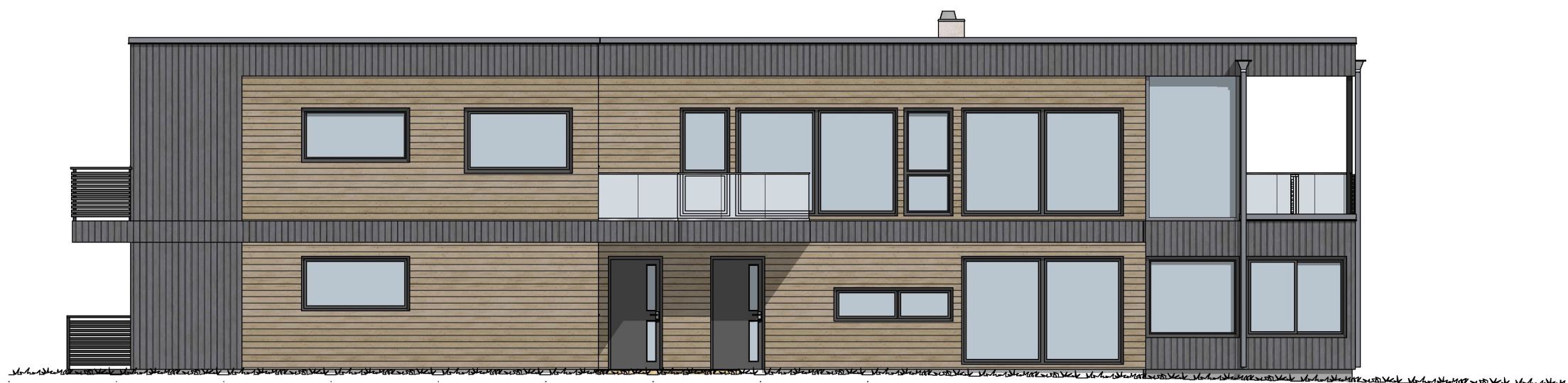
1:100 Fasade Nordvest