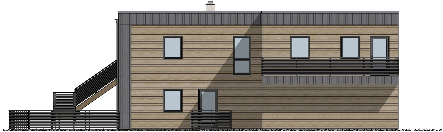
1:100 Fasade Nordøst