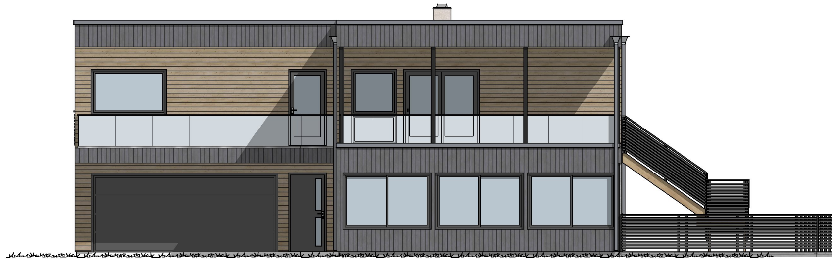
1:100 Fasade Sydvest