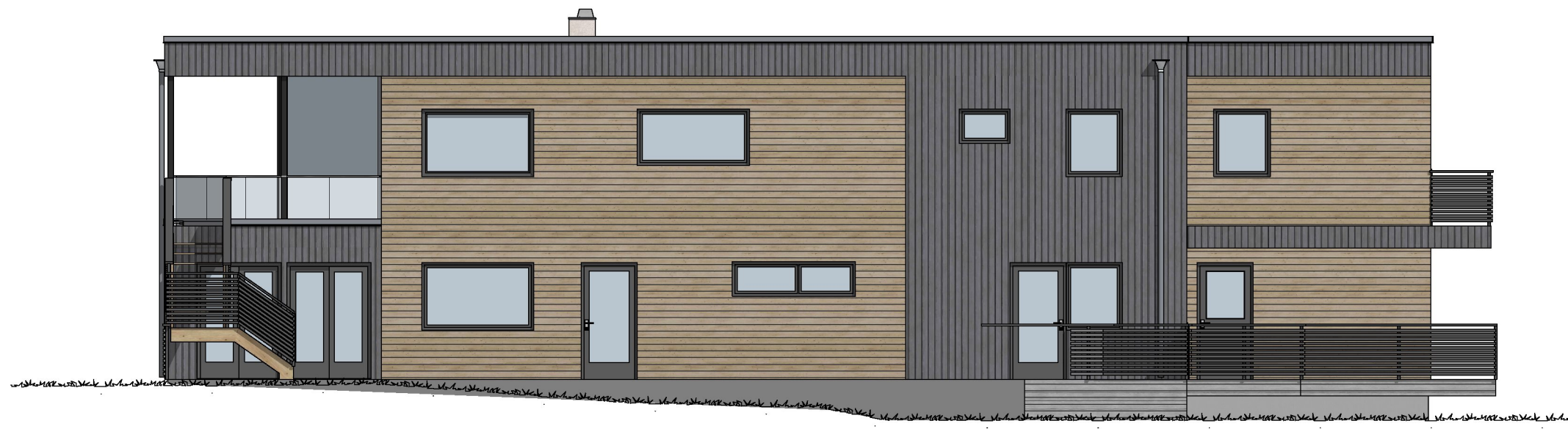
1:100 Fasade Sydøst