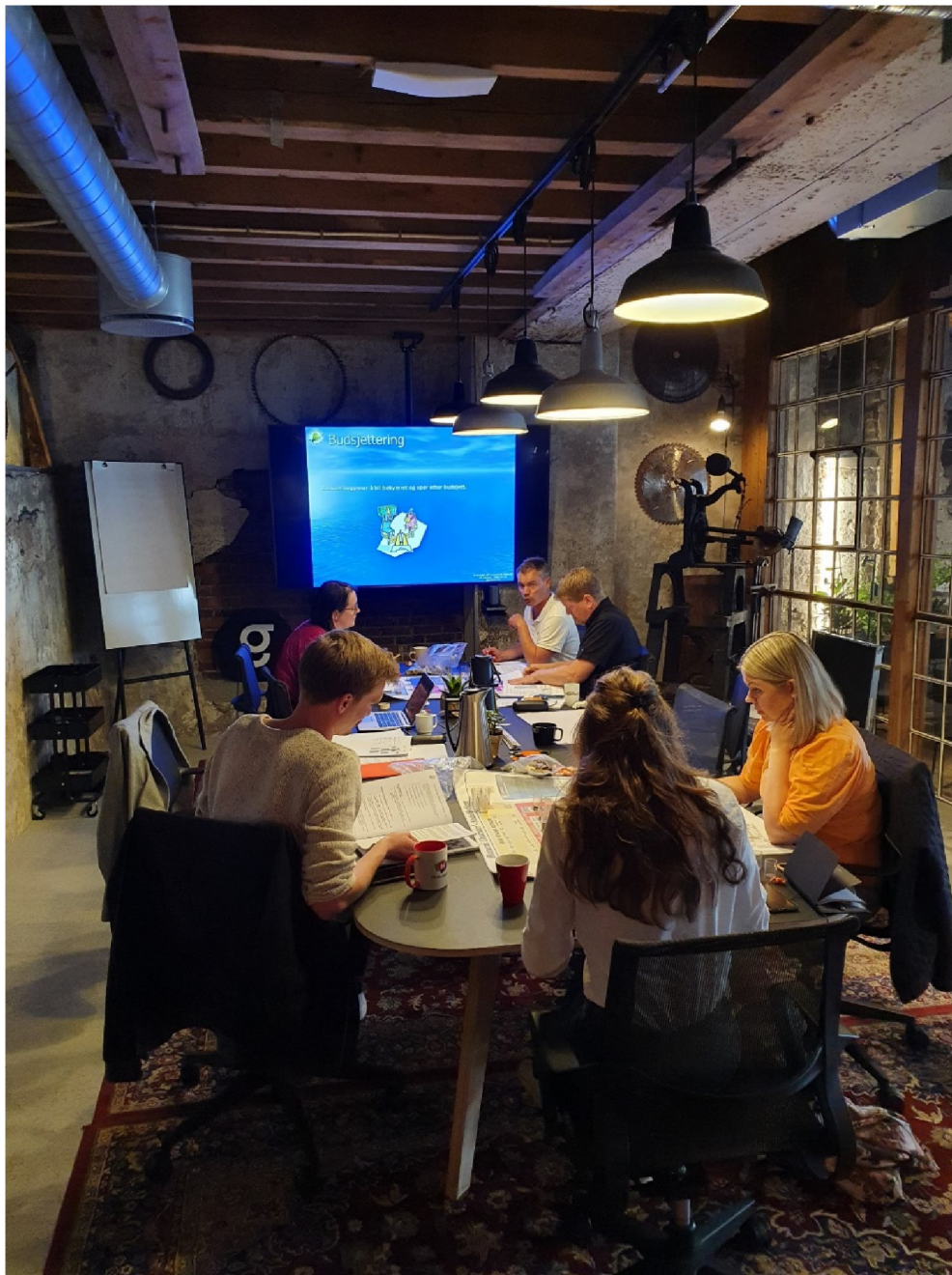
Bilde fra økonomikurs på Gründerloftet i Haugesund