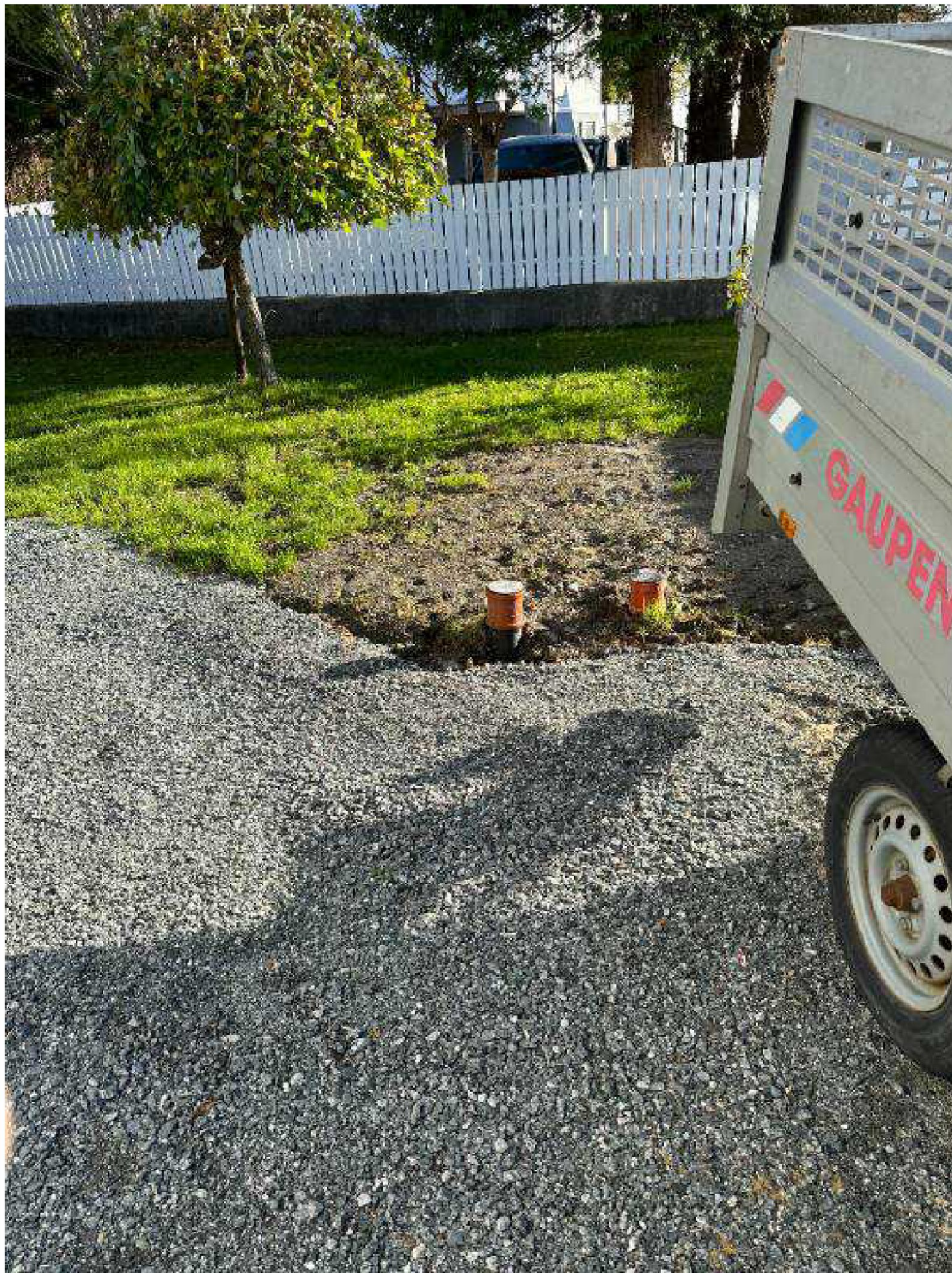
Bilde etter opprydding