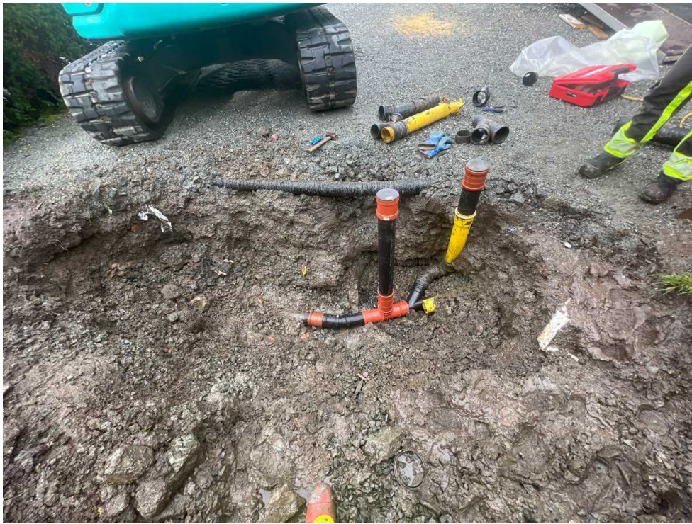
Utbedring av ødelagt rør ferdig