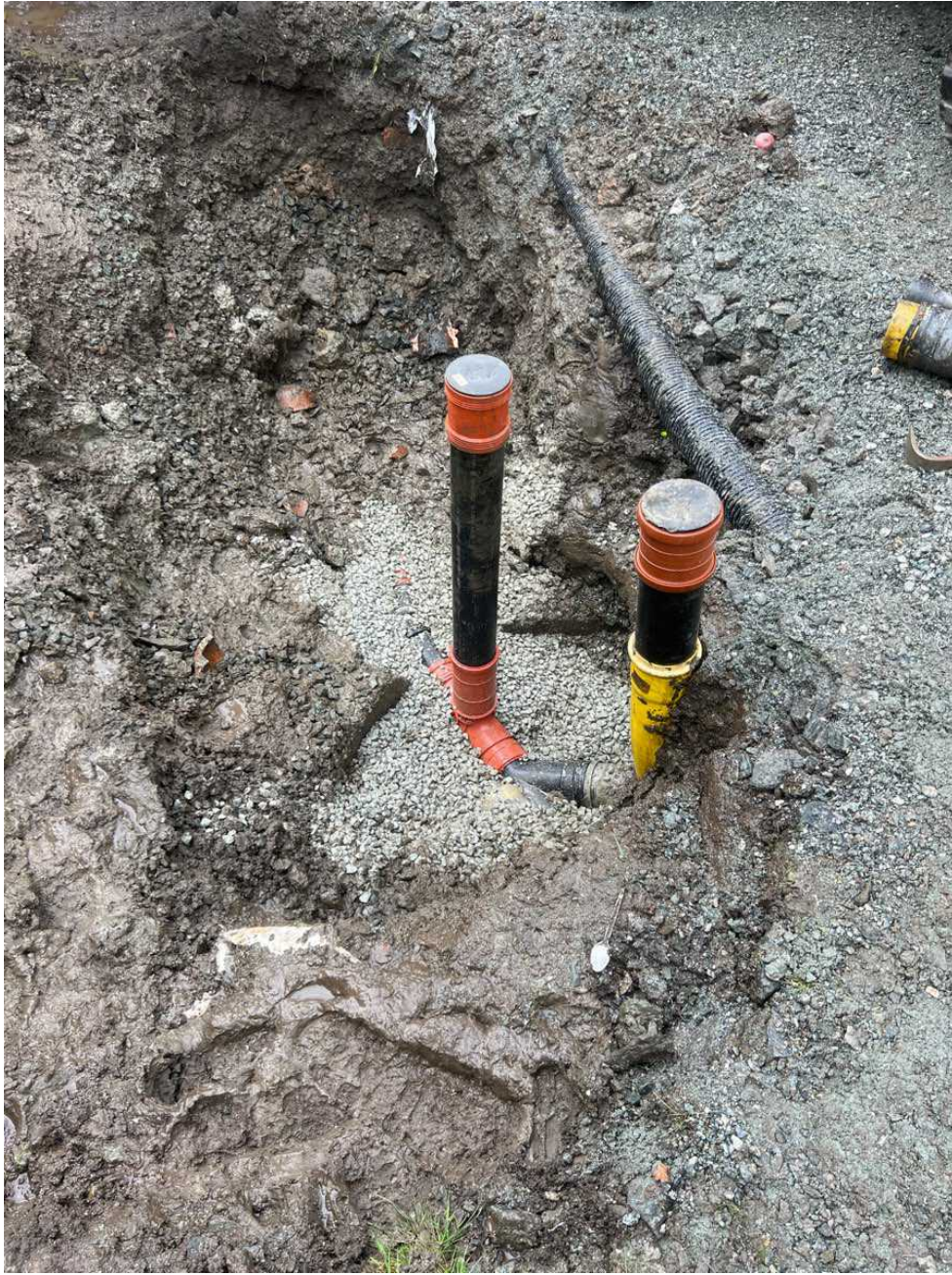
Ført opp begge stakerør. Utbedret skadd stakerør på samme plassering.