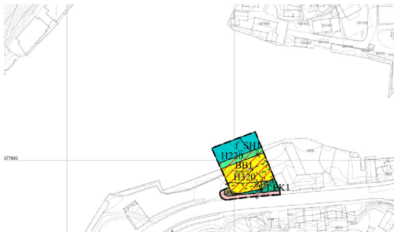
utsnitt av planforslaget

Det opplyses at planforslaget «tilrettelegge for et nytt leilighetsbygg på 4 etasjer fra gateplan (med parkeringskjeller, som utgjør 5.etasjer fra sjøsiden). Leilighetsbygget skal inneholde 9 leiligheter. Det tilrettelegges også for privat felles småbåthavn i sjø, med en 3,5 meter bred kai, som reguleres som turveg. Kaien skal etableres uten ny fylling i sjø. Planforslaget legger opp til etablering av en ny lekeplass som delvis legges under tak, og som har en totalstørrelse på 180 m 2 ».