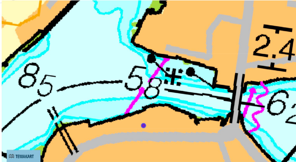
utsnitt av sjøkart

Det er mange båt plasser vest av vippebrua og disse må passere planområdet. På nordsiden av seilingsløpet inn mot vippebruen er det en grunne som er merket med jernstang, jf. sjøkartutsnitt nedenfor, som gjør at båtene går på sørsiden og forholdsvis nært opp til planområdet. Det er derfor viktig at det ikke legges til rette for fortøyning av båter i dette området i et omfang som tar sikt og påvirker fremkommeligheten i sjøområdet.