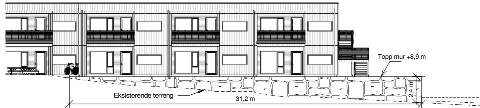
Oppriss mur mot Øst 1 : 200