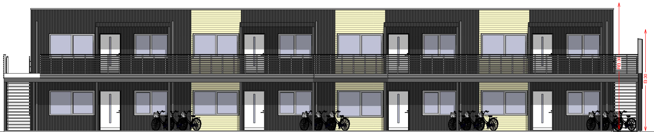
Fasade mot nord 1 : 100