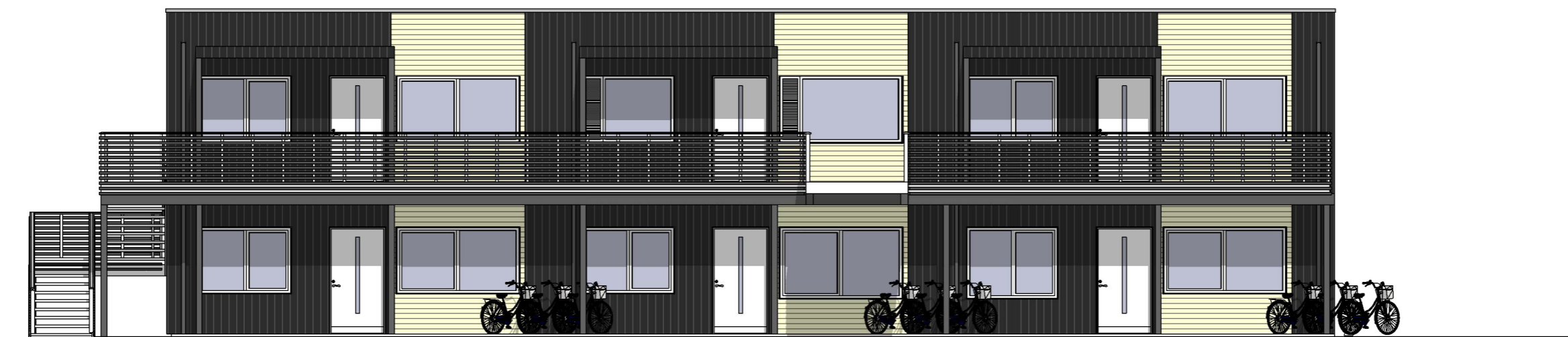
Fasade mot øst 1 : 100