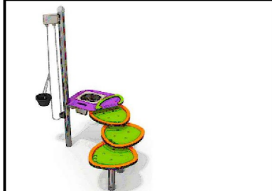
LEK1 - Sand- og vannbord art. B7020 fra Norsk lek og park eller tilsvarende