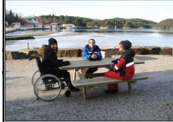
PRK2 - Piknikbord, art. 518 fra Norsk lek og park eller tilsvarende