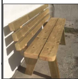
PRK1 - Benk i samme materiale som piknikbord, eksempel på utforming,