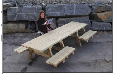
PRK3 - Piknikbord, art. 9108 fra Norsk lek og park eller tilsvarende